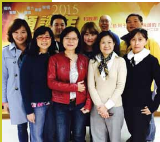
宣教植堂處同工合影