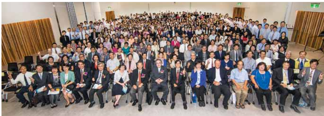
靈神25週年慶大合照