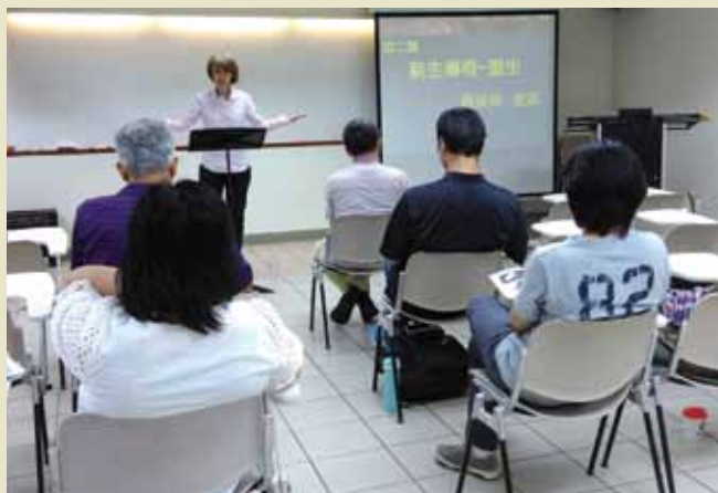
慕道課程專為慕道新朋友設計，幫助其在信仰真理上扎根。