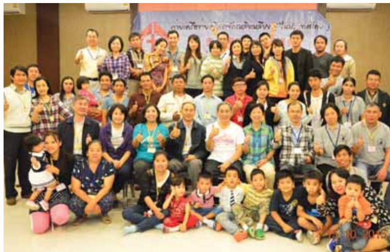
泰北牧家退修會合影，攝於2015年10月