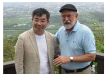
蘭陽靈糧堂黃牧師與依坦牧師