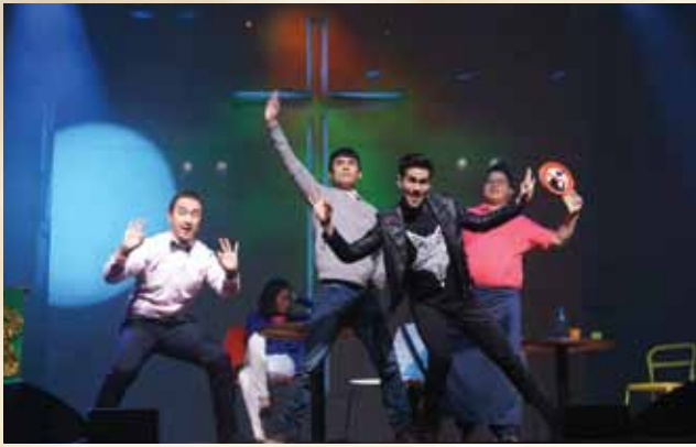
聖誕節Big Day「昨天，愛還在」戲劇。