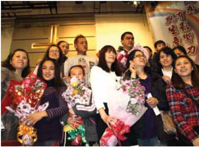
華興靈糧福音中心：受洗後合照