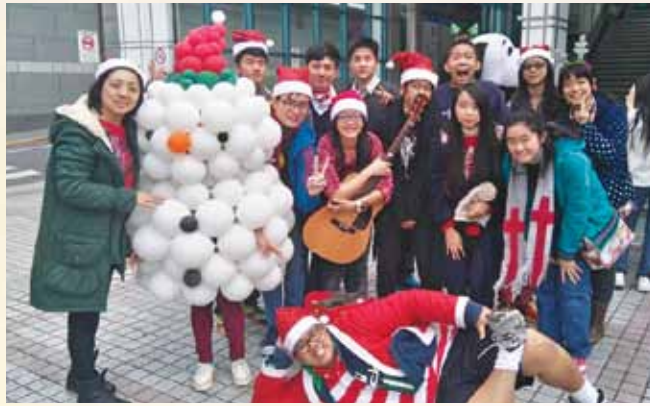
文山學生中心與社區連結。