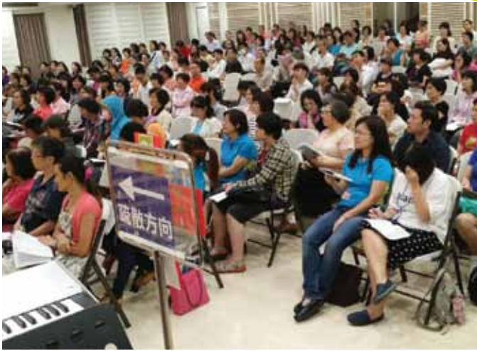
「苗圃八福人生」上課情形。