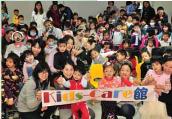
Kids-Care館育兒友善園聖誕節社區活動