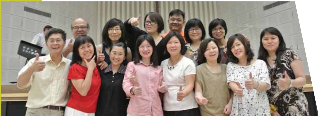
畢業典禮領獎後，小組學員和同事合影。