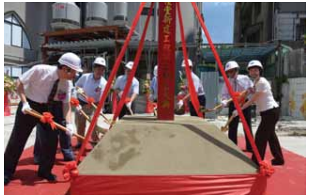
宣教後棟副堂開工動土典禮