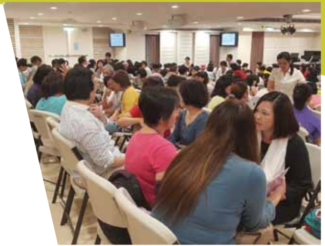
課堂後學員分組，熱烈討論分享。

課的人，舉辦畢業典禮。除了豐盛食物，又可上台接受畢業禮物、證書、拍照留念！這是歡迎畢業生親友一起歡樂的時刻，所以可接觸新的福音朋友，期待他們下期來嚐主恩！