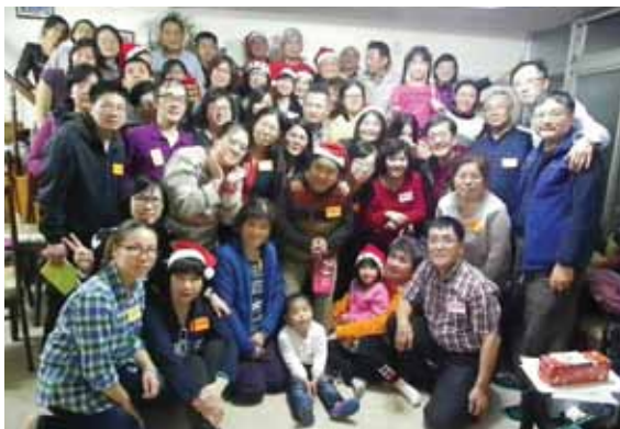
牧區小組聖誕活動