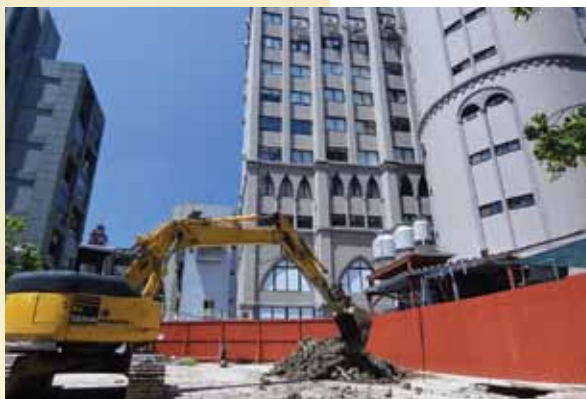
宣教後棟副堂動工

2015頌讚年從歲首到年終，神在台北靈糧堂、國度領袖學院、靈糧全球使徒性網絡都施行了奇妙的大事。全年度總計受洗人數782人，短宣隊106隊，短宣人數1663人。感謝主大大賜福教會，賜下各樣人力、資源，使用牧養處及各福音中心盡心竭力建造榮耀的教會，透過國度領袖學院訓練眾多的神國工人，也藉著靈糧全球使徒性網絡連結眾教會眾分堂，帶下國度的榮耀。進入更新的季節和新年度，我們要獻上感恩和頌讚，並預備整齊，以迎接2016年的新挑戰！