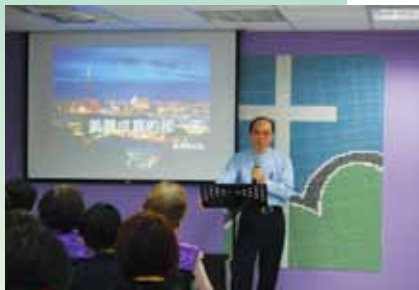
南信義靈糧福音中心開堂感恩禮拜