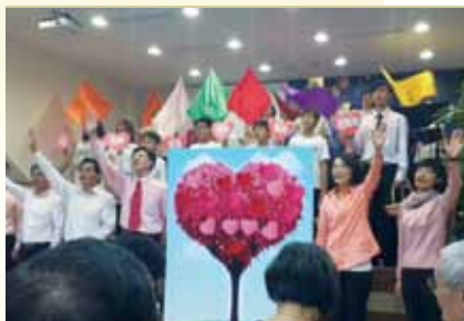
內湖義靈糧福音中心第一次主崇