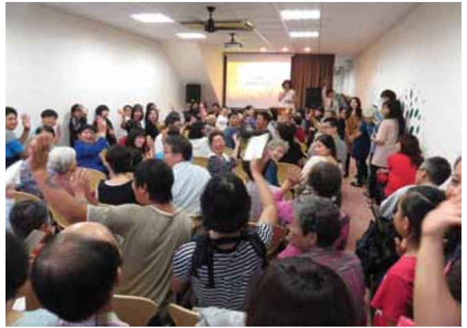
五結靈糧福音中心開堂禮拜

傳福音之外，也投入服事當地的原住民，並在城市的合一和轉化中扮演重要的角色，這是當初沒有想到的，感謝神格外恩膏亞庇靈糧堂。