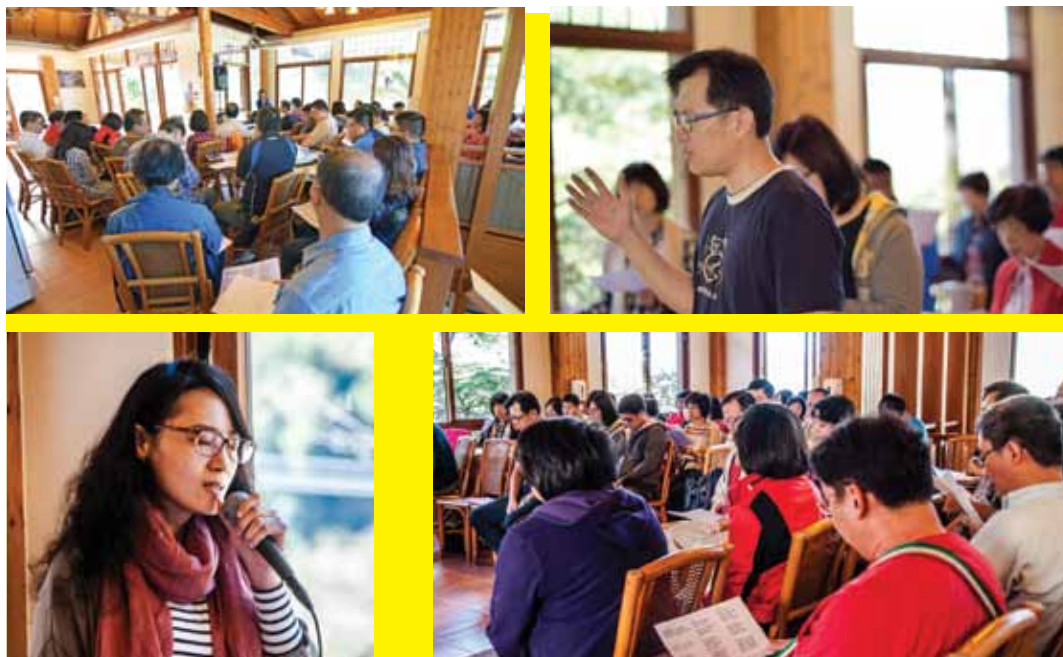
上帝真正喜悅的，不是我們作了多少事工，而是要我們親近祂，完全屬於祂。圖為2015事工管理處退修會。

老我，就是我們的「自以為是」；第二就是因為我們的「罪」。因此，我們要接受聖靈的提醒來悔改，用聖潔公義來服事神。當我願意學習聽神的聲音時，我發現神開始拆毀我的老我、我的自以為是，並看見自己的罪。神透過一些環境來破碎我，以至於我現在更容易聽見神對我說話。