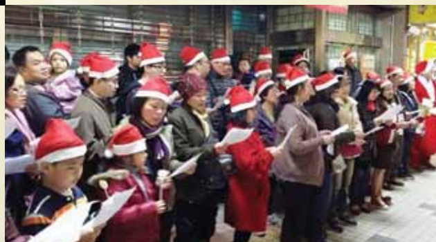
南勢角靈糧福音中心平安夜報佳音

印尼語區在12月20日透過舞台劇「The Journey」向眾人分享福音，當天有超過70個人決志信主。內容是一個小女生尋找回家之路的故事。她在迷惘的路途中，遇見了一些關鍵人物，分別是 Mr. Faith (信)和 Mr. Hope (望)，最後因著「風」(預表聖靈)的引導，遇見「愛」(預表耶穌的一位木匠)。