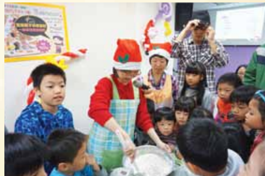
12月12日南信義靈糧福音中心聖誕親子烘焙派對：社區父母陪伴孩子一起動手蓋薑餅屋，烤餅乾。

中山靈糧福音中心在12月24日晚上，由學生區主辦紅吱火雞趴——輕音樂場「心中的音符——在這裡找到愛」，邀請參與的朋友把夢想寫在卡片上，禱告交託在神手中，隔年的十一月，教會將會寄回給填寫的人檢視自己的夢想有沒有實現。有些夢想成真的故事甚至可能成為次年的劇本，以戲劇演出。