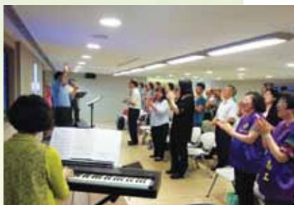
松江義靈糧福音中心第一次主崇