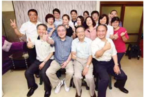
2015年6月17日一線開業祝禱