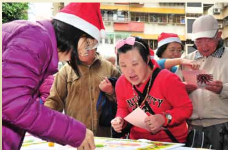
12月12日台北靈糧堂東區承增牧區舉辦「民福里希望平安喜樂活動」