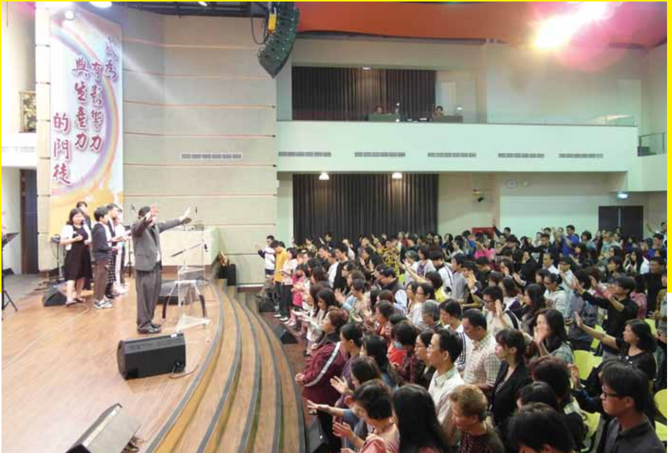
蘭陽靈糧堂主日為分堂差派祝福