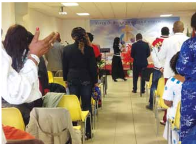
瑞吉歐艾米利亞分堂