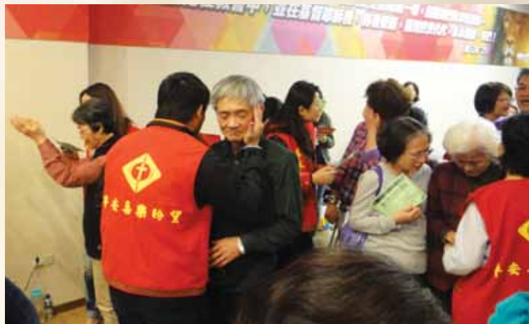
2015年12月24日內湖靈糧福音中心「溫馨聖誕」，人們前來尋求耶穌的醫治。

永和靈糧福音中心12月20日的聖誕主日崇拜，教會坐滿了新朋友和弟兄姊妹；當天的見證分享是以類「真情部落格」的訪談方式進行，邀請會友中的一個家族來現身說法，當他們述說全家人經歷神拯救的往事時，許多兄姊頻頻拭淚，不住為這一家向神感恩。