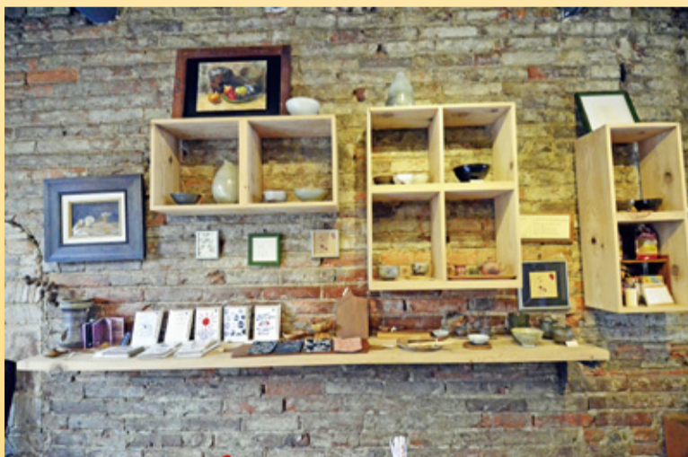
▲兩側是不加以粉刷的「紅磚牆面」，盡情散發著樸拙不矯情的面貌，牆上掛著藝品、木作品，這些創作展示品，都有專門的價格。