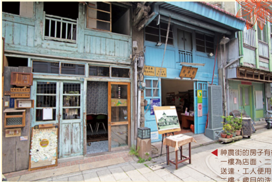
▲神農街的房子有很多是「店屋」，一樓為店面、二樓為倉庫，貨物送達，工人使用繩索將貨物吊上二樓。歲月的洗禮，使門窗與陽台非常帶味。

台南，大家眼中的古都，擁有許多的古蹟和老街，近年來開始有了許多新活力。「神農街」就是目前台南市保存最完善的老街，充滿了清朝和日治時代的房子，老街所在的位置正在「五條港」的中央，而五條港是清初台灣對外主要的門戶。老街昔日繁華不再，取而代之是進駐不少年輕藝術家，為老街注入源源不絕的活力。不趕時間，可以在這裡放慢腳步，享受老屋的氛圍，有哪一個店家吸引你的興趣，就晃進去看看。聽說「慢慢鳩生活木作」是已有296年的清代建築喔！