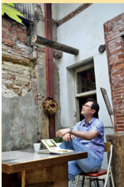
▲「天井」下，沉澱在老屋歷史的氛圍裡，緬懷一磚一角的歲月故事。慢慢鳩，慢慢走，慢慢嚐，慢慢想，彷彿進入時空的隧道。