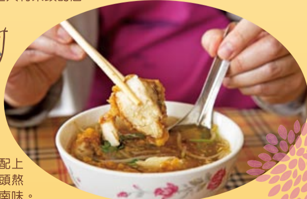
炸得酥酥的土魷魚，魚肉厚實且新鮮無腥味，老闆還選用豆芽菜入湯，令人驚呼，配上帶著甜味以柴魚、蒜頭熬的羹湯，是道地的台南味。