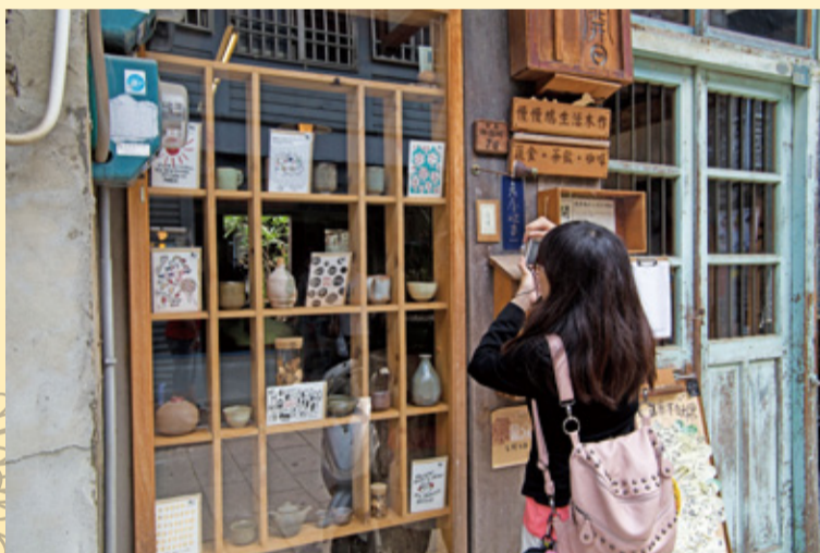
▲「慢慢鳩生活木作」臨街木格裡陳列各式陶杯陶壺，引人駐足拍照。斑駁木門褪色油漆是老舊的證明，木頭原色的木箱木牌散發很強的魅力。