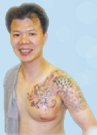
▲ 信主後除刺青照片