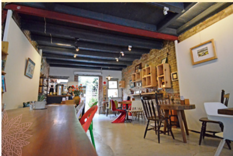
▲慢慢鳩這棟老屋共有三進，第一進為蔬食茶飲空間，可以慢慢享受老屋風味和木作品。中間為天井，最後則為提供課程的木工教室。