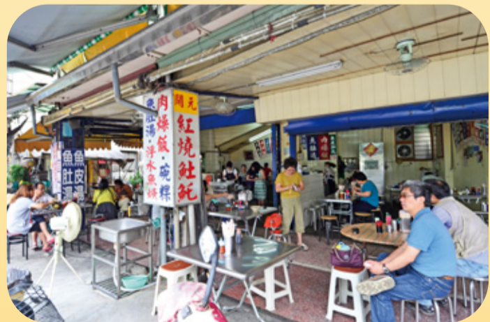
▲「開元路紅燒土魷魚羹」跟大部份台南小吃一樣，有著不起眼的外觀，相當有在地的味道，若不是當地人帶路，就容易錯過這大有來頭的店。