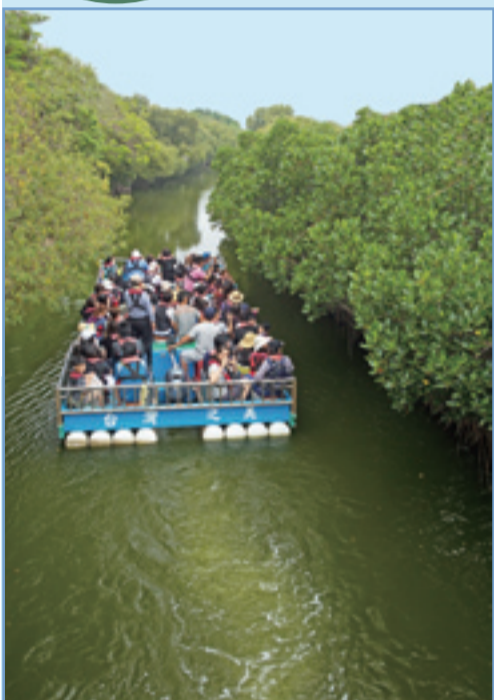
綠色隧道。約有800年的歷史，沿著河道緩緩前進，就會進入紅樹林。四草大眾廟東側的「竹筏港」是台灣第一條人工運河。

四草，位於台南市安南區，是鄭成功登陸臺灣之後跟荷蘭人的第一戰場，目前四草大眾廟後方保有鄭荷戰爭骨骸。又因境內擁有紅樹林所形成的「綠色隧道」，已是台南著名的旅遊景點。其綠色隧道有別於一般的綠色隧道，它是水上綠色隧道，需要搭船悠閒地欣賞。其鄰近的「鹽田生態文化村」位於台灣第一個瓦盤製鹽工業區內，假日時，遊客有機會看見鹽工實地採收鹽田的作業實況。