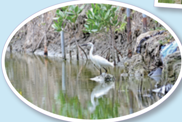
水道旁的濕地上到處都是招潮蟹、和尚蟹、彈塗魚等生物在活動，另外，也不時可見小白鷺鷥在周圍休憩、低翔，可說是最棒的「自然教室」。