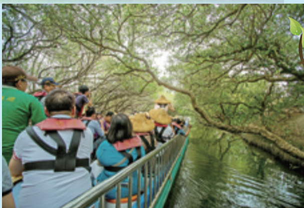
這裡擁有「台灣迷你型的亞馬遜河」之稱，遊客需要搭乘竹筏才能進入到仙境般的綠色隧道，穿梭在波光 and 樹林的倒影交錯裡。