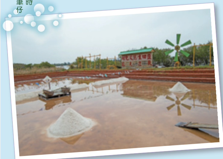
「鹽田生態文化村」可藉由導覽解說，參訪瓦盤鹽田、鹽田體驗、鹽產品DIY、瀏覽鹽田風光、舊有鹽村建物、鹽田地方文化資料館……。