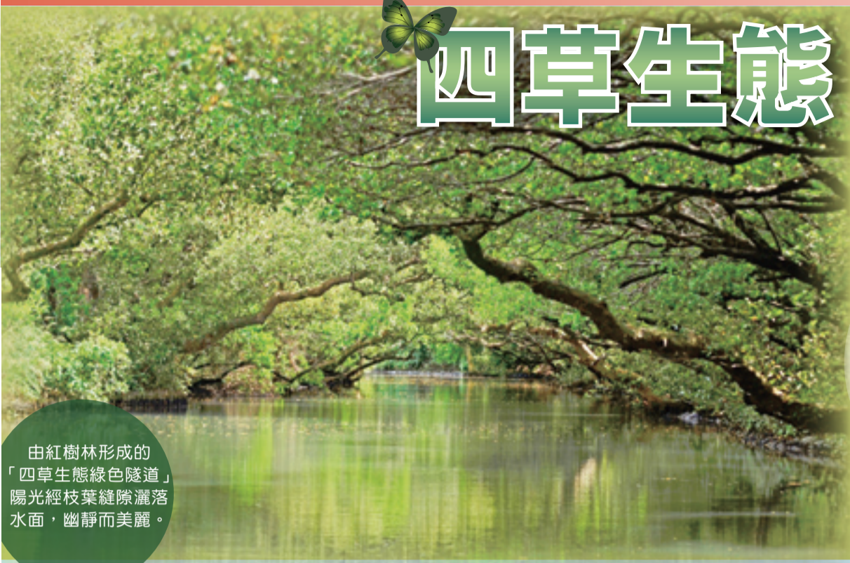
由紅樹林形成的「四草生態綠色隧道」，陽光經枝葉縫隙灑落水面，幽靜而美麗。