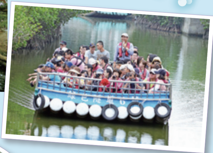
船上配有專業的「生態解說員」，為遊客們解說沿途不同的紅樹林，也貼心的在樹上掛有說明，讓遊客清楚知道哪些是水筆仔、海茄苳等。