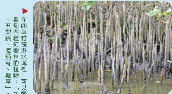
在四草竹筏港水域裡，可以同時看到四種紅樹林的植物：「水筆仔、五梨跤、海茄苳、欖李」。