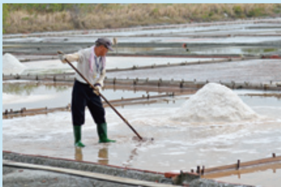
引進的海水經過大、中、小蒸發池，待海水濃度提高到24度以上，攪破浮在水面的鹽花，用工具「鹽收仔」集中成一堆堆的鹽。