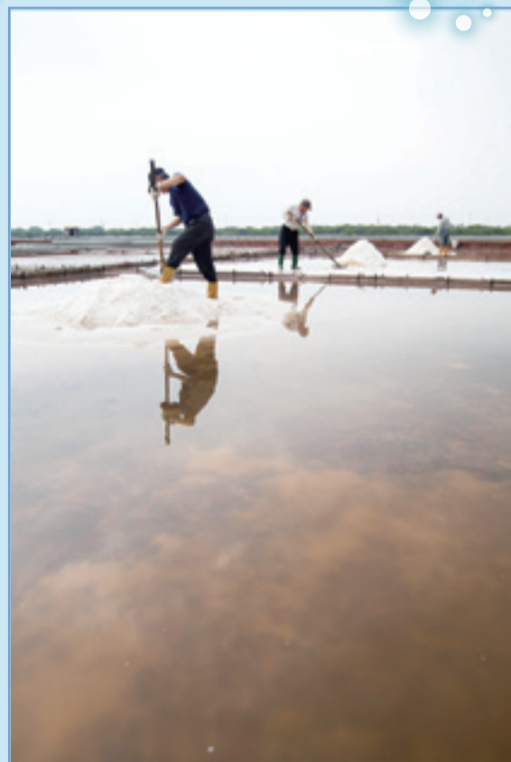
這裡保存了日據時期的鹽村文化景觀，來到這裡就有走入時光歷史的錯覺。