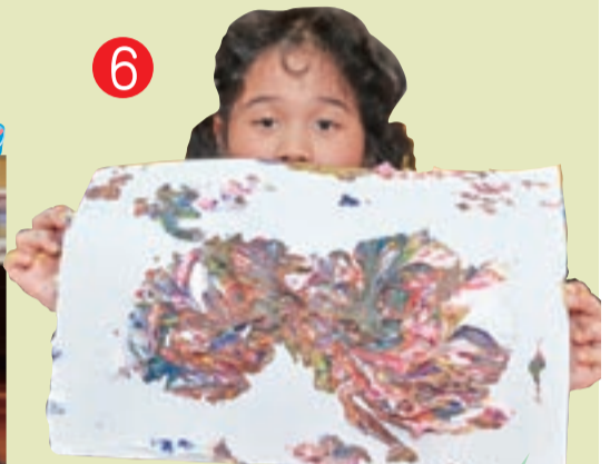
6 ▲ 轉印後的成果，好像……奧利奧餅乾還是雷神巧克力阿。