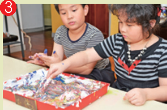
3 ▲ 用湯匙在刮鬍膏上隨意畫出紋路。顏料混合的效果令人驚嘆了！很有趣吧！