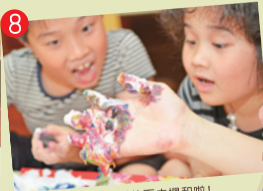
8 ▲ 媽媽忍不住也把手伸下去攪和啦！