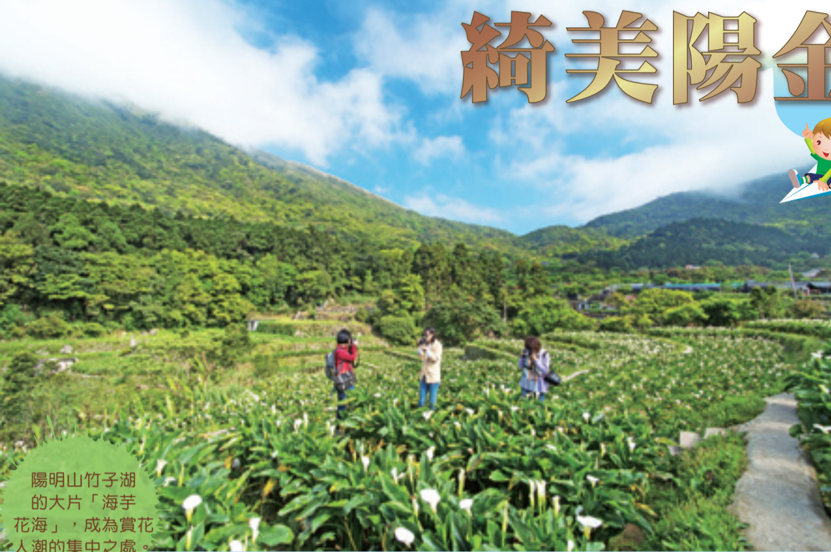
陽明山竹子湖的大片「海芋花海」，成為賞花人潮的集中之處。

陽金公路，許多旅人都愛它，愛它沿途綺麗。每年竹子湖「海芋季」期間約為三月底至四月底，中外旅客笑開懷地踩在海芋田裡，日光底下捕捉海芋的獨特。第二站是陽金公路7.2K處的幽靜桃花源「八煙聚落」，經過環境的復育，可以看到石砌的房屋水圳，重現的梯田，及絕美詩意的水中央景觀。來到陽金公路起頭，可到老街用餐，下午時分，再前往附近的水尾漁港，問一下當地人，就可找到「神秘海岸」的一線天入口，親身去體會大自然鬼斧神工及柳暗花明又一村的喜悅。