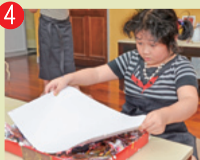
4 ▲ 接下來將紙直接蓋印在刮鬍膏上。