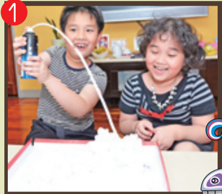
1 ▲ 首先準備一個托盤，大膽的噴出一大層刮鬍膏，哇哇哇！