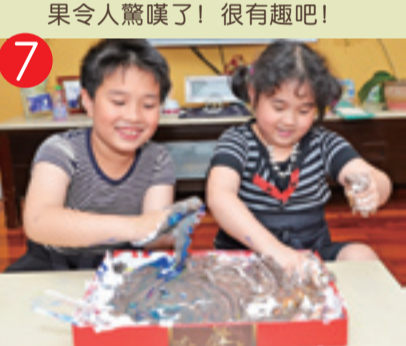
7 ▲ 四隻手忍不住伸手下去瘋狂攪和，混亂的開始！