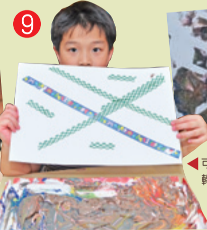
9 ▲ 可以在白紙上貼紙膠，轉印後再把紙膠撕去。