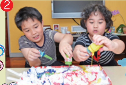
2 ▲ 再加入喜歡的顏色，這次使用的是廣告顏料。