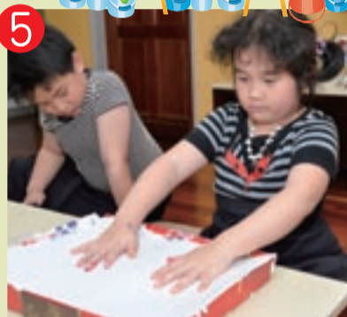
5 ▲ 記住只要輕輕的按壓即可。