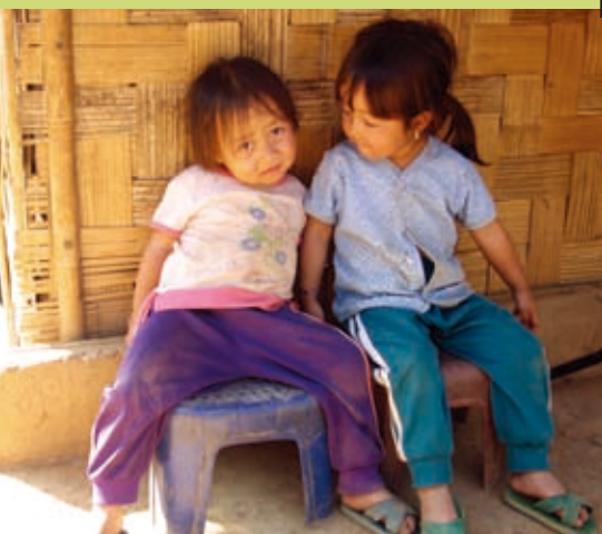
▲貧窮且交通不便的紅磐石村，十五歲以下的孩童就有三百多位。

今年三月是新生命福音戒毒中心成立十週年，目前中心人數大人小孩約有兩百七十人，連同各分堂與學生中心、孤兒院全宿者，總人數