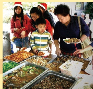
▲ 新移民愛宴。為眾人預備了一場身心靈皆飽足的愛宴！