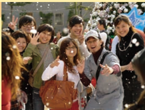
▲ 希望廣場的人工雪景把台北帶進聖誕季節的氣氛！