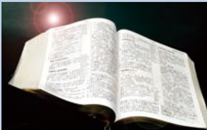
▲ 教會運作的四個輪子——神的話(Word)

神的話是我們生命的糧，也是我們生活與行事的準則。當我們鼓勵兄姊進入職場、轉化職場時，教會應以神的真理來建造他們，讓兄姊有正確的價值觀，才能在職場作光作鹽，不被世界同化。使徒行傳廿章，保羅與以弗所的長老訣別時說：「所以你們應當警醒，記念我三年之久晝夜不住的流淚、勸戒你們各人。如今我把你們交託神和祂恩惠的道；這道能建立你們，叫你們和一切成聖的人同得基業。」保羅為以弗所教會打下的真理根基是有果效的，啟示錄二章記載以弗所教會因這根基，能分辨試驗出使徒的真偽，由此可見神的話語對使徒性教會的重要性。