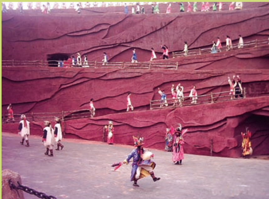
▲麗江東巴作法