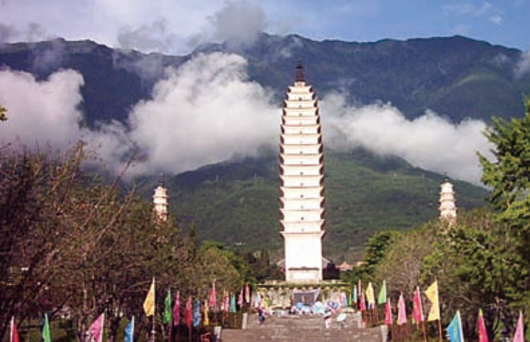
▲大理崇聖寺三塔