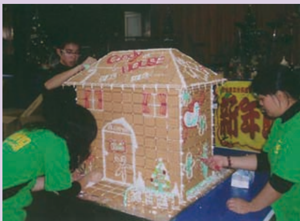
▲台西的甜蜜蛋糕屋