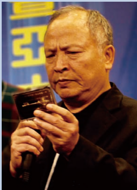
▲周牧師相當看重象徵打開福音大門的大衛金鑰匙。