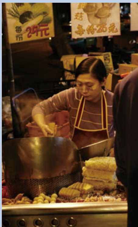
▲神的愛使我們與基層從業人沒有距離。

當我們踏入宣教禾場，就是進入爭戰領域；這段時間同工們都領教了猛烈戰火，除了連結團隊，一手作工一手拿兵器；我們更需要代禱守望的勇士，好叫主的工人凡事靠主站立得穩，不怕仇敵威嚇，專心一志作成主的工！在拓展新據點上，更須透過聖靈裡的禱告，明白主的引導，不急著摘青澀未成熟的果子，更能及時收取已成熟的果實！因此，求主帶領代禱者，成為第一線服務業宣教事工的守望者。