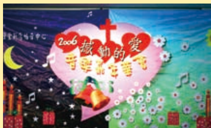
▲新店福音中心聖誕派對

今年聖誕節有泰國、越南、柬埔寨、和日本的外籍新娘參加我們的晚會，曾得過北縣民族舞蹈冠軍的她們，與我們一起用中文唱聖誕歌曲。