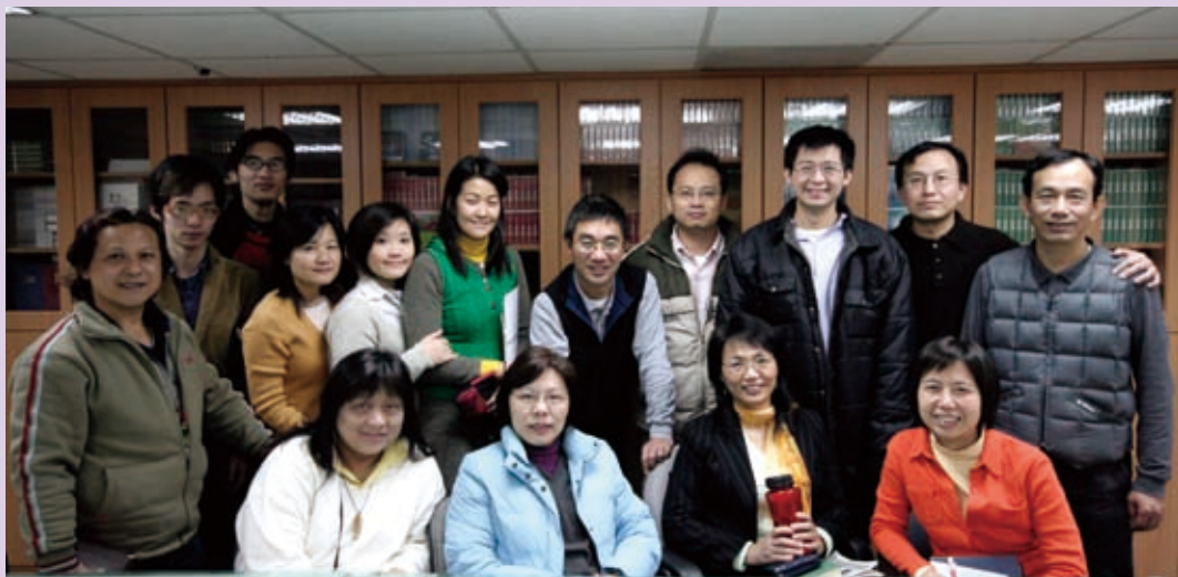
▲媒體中心同工合影。

去 年九月，媒體中心的整合暫時告一個段落，同工們的座位都集中在一起，組別與組別間同工交叉重疊，工作的氣氛和契合度有很大的提升。這個動力，尤其從影視和資訊聯合，文字和影視聯合，得到印證。