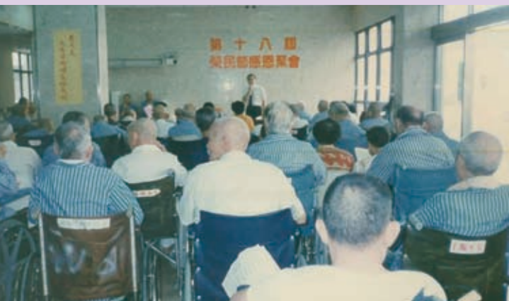
▲未來教會的長者服事會越來越重要。