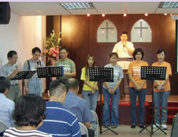
▲圖為長庚生命靈糧堂設立感恩禮拜，弟兄姊妹齊心敬拜禱告。