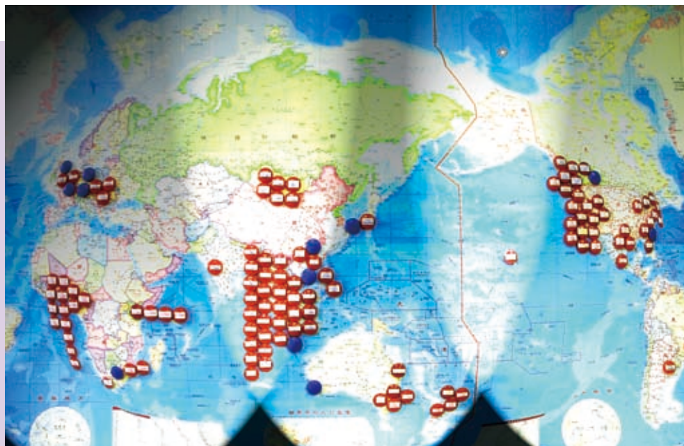
▲靈糧分堂已遍佈台灣及全世界，就像葡萄串一樣。(圖／王瑞庚提供)

洲、歐洲、非洲及大洋洲，因此整個靈糧家族正從四面八方，將福音傳向耶路撒冷，目標就是共同迎接榮耀君王的再來。這也是神透過台北靈糧堂的主任牧師周神助傳遞的異象「同一心靈·同一腳蹤」。