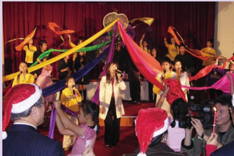
▲讓愛波瑞Parade——愛從神來，繽紛的放射彩帶象徵神愛的光芒與祝福。