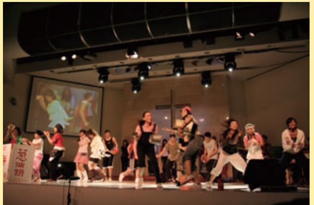
▲青年聖誕 JD舞團表演