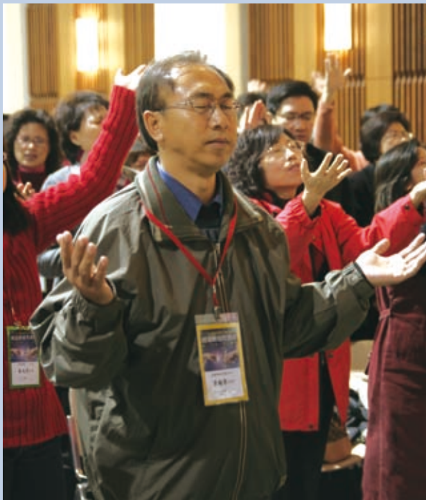
▲我們要有謙卑渴慕的心，才能蒙聖靈觸摸。

但有時我們會感覺置身在祝福以外，如果你在生命當中某些領域有掙扎，你要像以色列一樣去爭戰，才能得地為業。在你生命中你已擁有喜樂、平安、醫治各樣的恩典，但你要去得著。雖然你還沒看見，但神應許我們已經得著了。