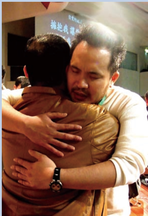
▲ 我們要從心裡的合一開始，彼此擁抱和接納。

腓立比書二章1~7節：「所以，在基督裏若有甚麼勸勉，愛心有甚麼安慰，聖靈有甚麼交通，心中有甚麼慈悲憐憫，你們就要意念相同，愛心相同，有一樣的心思，有一樣的意念，使我的喜樂可以滿足。凡事不可結黨，不可貪圖虛浮的榮耀；只要存心謙卑，各人看別人比自己強。各人不要單顧自己的事，也要顧別人的事。你們當以基督耶穌的心為心；祂本有神的形像，不以自己與神同等為強奪的；反倒虛己，取了奴僕的形像，成為人的樣式。」說明愛的定義，是在合一裡；不自私、不爭競、看別人比自己強，願意服事人、向人低頭、向教會低頭。