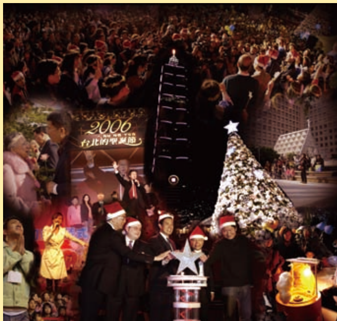
▲打開屬靈大門的鑰匙，為台北市甚至台灣教會界帶來轉化、合一的可能！