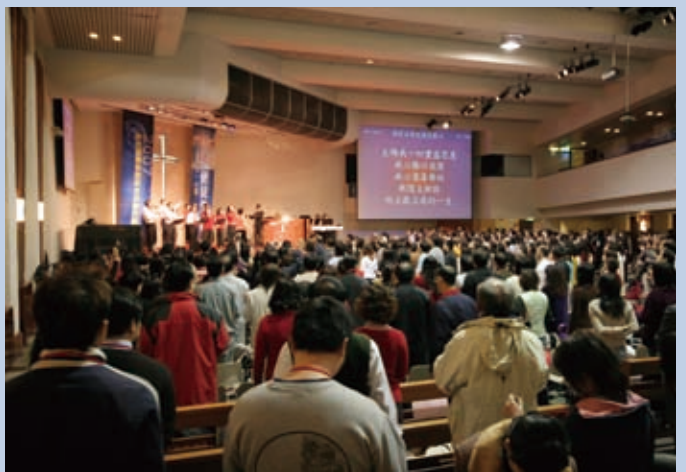
▲耶穌為我們選擇教會，而教會就是我們學習合一的地方。

蒙召的人即使一人獨處，也永不孤單。在他靈裡有一個屬靈的看見，他時刻都與神同行，三位一體的神住在他的裡面，使他可以破除孤單的後遺症，就是自憐、自我拒絕和自我防衛。