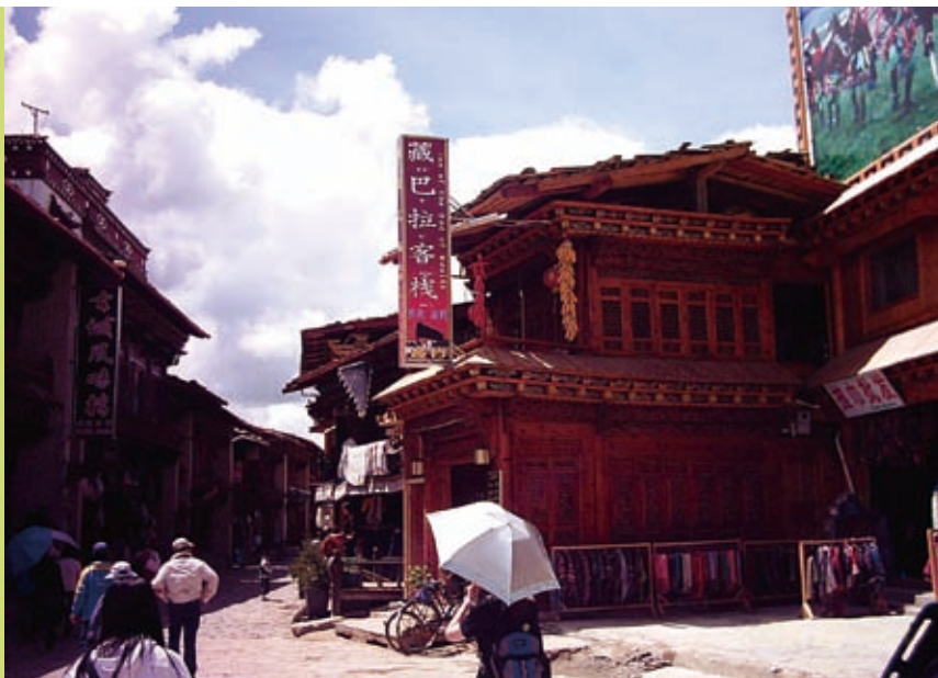
▲中甸老街

在看完「印象麗江」之後，秀場要我們許願並投入香爐，我們起身要走，才發現秀場後有一條通道，通往他們原始的祭壇，祭壇面對玉龍雪山，好幾層樓高，碩大的香爐即在其上，梯階上大東巴正以法器在觀眾身上作法。我們不斷禱告地上了祭壇，在其上繞行禱告，東巴似乎知道，一名老東巴又上來灑水。我們相信禱告才是真正的潔淨，潔淨這地交鬼的污穢。並求造天地的主，得以重新在此享受我們的敬拜。這是我們除了西雙版納的經驗後，再一次體認偶像崇拜與民族文化包裝在旅遊行程中的可怕。