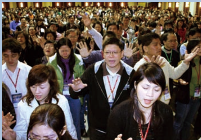
▲與會者領受兒子的祝福。

此次特會，母堂還特別編列了一千五百萬元預算，作為眾分堂無息貸款的建堂基金，周牧師盼望分堂能感受母堂的心：願意看見分堂的需要並且滿足需要，一起領受「同一心靈·同一腳蹤」。