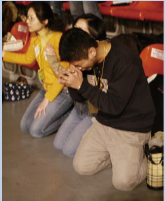
▲ 預苦期讓我們學習透視人世間種種結構性罪惡與不義，預備我們在痛悔與對上帝淨光之處的救贖之渴慕中，來遇見主。