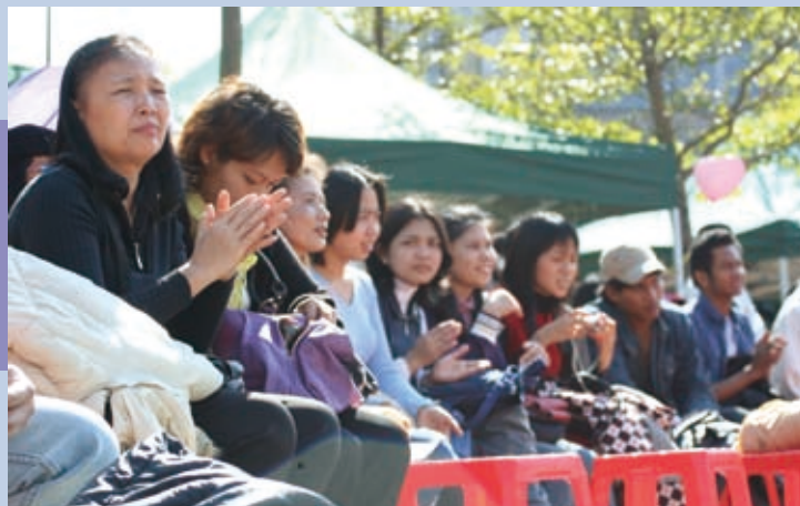
▲為印尼語牧區會友所邀請來的外勞朋友。

回教徒向來被認為是傳福音的硬地，他們受洗歸入主名，必須承受來自家人的壓力，甚至因此付上生命的代價。印尼語牧區林玉華牧師剛服事在台印傭時，常發生聚會人數稀少的情形，同工們便改成主動出擊，在公園、街上邀人參加聚會，沒想到受邀者中有很多是虔誠的回教徒。