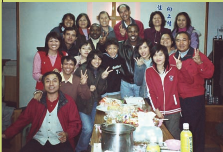
▲圖為龜山榮耀靈糧堂的愛宴。