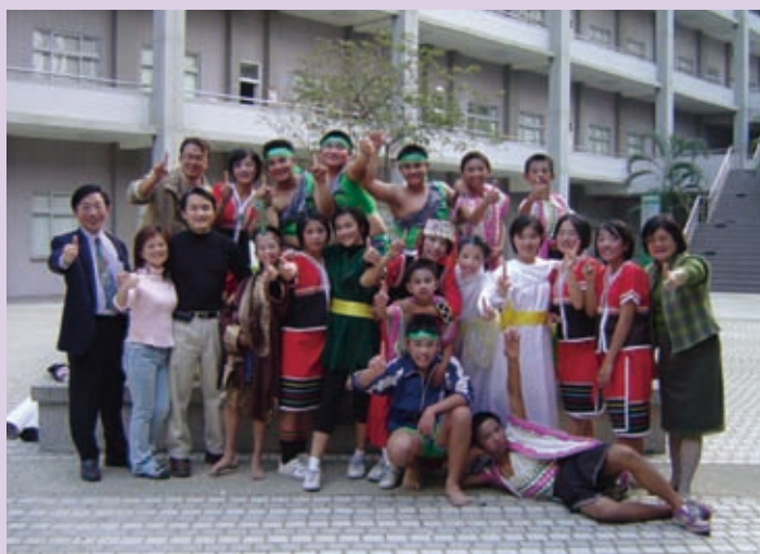
▲南投的原住民孩子們。