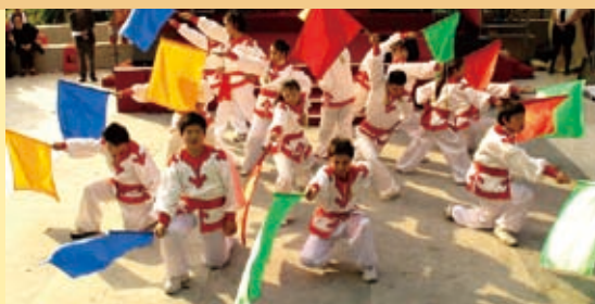
▲ 整個十二月喜樂家族有許多場表演，他們精采的演出，代表了平日的認真，他們是天父喜樂的孩子！