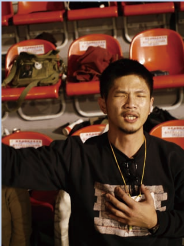
▲ 認識神的美好與愛，並深度省察、認知自我的問題，是一體的兩面。

整個預苦期的中心意義，是記念耶穌的道成肉身、受苦、受死、與復活，因此透過經文默想與基督同行，隨著祂的降世與生平，一直和祂同行至各各他的十字架。我們生命中的林林總總就在默想基督的生平中，如同照鏡子般輝映出來。我們不過是灰塵並要歸回塵土，生命的律亦本如四季既美又無情，但是基督使我們超越了塵土，祂的死亡所付出的，與所要轉換出來的，不是輕忽的一個復活節慶祝可以體會完全的。願意認真過復活節期的人，才有機會真正地認識生命的苦與罪、羞辱與榮耀、痛悔與重生。