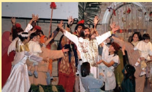
▲ 原住民聖誕佈道會

今年為了異象「贏得都會原住民」，首次將歷年來的戶外聖誕活動移師教會舉行，讓原住民過一個不一樣的慶祝方式，並藉此把原住民吸引回教會。晚會中以原住民歌舞劇、原住民大會舞、短講方式呈現，博得與會者熱烈的回應。當天晚上約有三百人參加，牧師呼召時，有四十多人回應，兩人願意決志受洗。