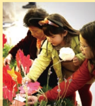
許願圍有一個小女孩的心願被天父聽到了！