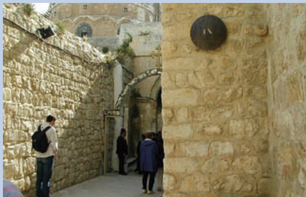
▲ 天主教會在每年的受難日都有「苦路十四站」的默想。圖為耶穌背十字架前往各各他，第三次跌倒的地方。