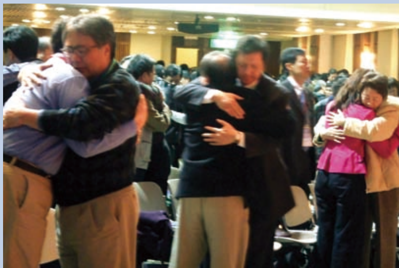
▲ 合一就是彼此相愛。