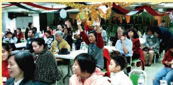
▲視障聖誕明蝦餐會