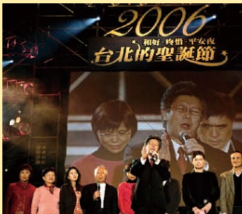
▲ 寇牧師帶領大家為台北市祝福！