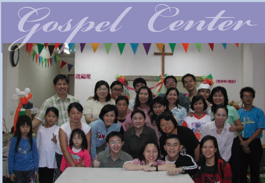
▲ 福源福音中心開幕活動。

「福源福音中心」從去年聖誕節開始有主日崇拜。在週間的活動方面：週二的儂人新天地，相當受女性朋友歡迎，曾開過糕點烹飪、插花、美容保養、跳舞等課程；週四目前是共讀「標竿人生」一書的成長小組；週六舉辦過兩次健康講座，一次兒童歡樂派。即使沒有活動，中心也有同工輪值，好讓左鄰右舍隨時可以進來坐坐。