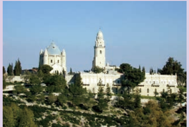
▲ 植堂的最終目標就是把福音傳回耶路撒冷。

植堂處的異象、目標與策略，絕對無法靠台北靈糧堂單一堂會就可以獨立完成，「在以色列植堂，把福音傳給猶太人」的終極目標，必須藉著靈糧家族的所有成員，同心齊力才能完成。把福音傳回耶路撒冷是從去年開始越來越清楚的方向。神在去年也開始為我們開了許多門，不論是從陸上的絲路，或海上的絲路，讓我們能透過這兩條路線，把福音傳回耶路撒冷。