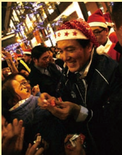
▲ 馬前市長(當時仍是市長)報佳音，發送糖果，萬人空巷。