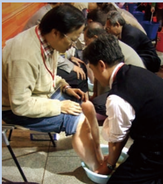
▲ 透過洗腳，洗出真實的愛與連結。

為了表達對分堂真實的愛，母堂決定效法耶穌為門徒洗腳服事的心，以更謙卑的方式——洗腳，期望使母堂為父的心轉向兒女、轉向分堂，也使兒女的心轉向父親。因此在聚會中，特別安排由周牧師和靈糧神學院院長、各處處長、區牧長和區牧、常務執事等一同服事分堂牧者——洗腳。