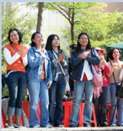
▲(圖／印尼語牧區提供)

去年聖誕節，印尼語區有許多回教徒受洗歸入主名，這些發生在他們身上的見證都彰顯出神的榮耀，讓我們一起進入他們的故事……。