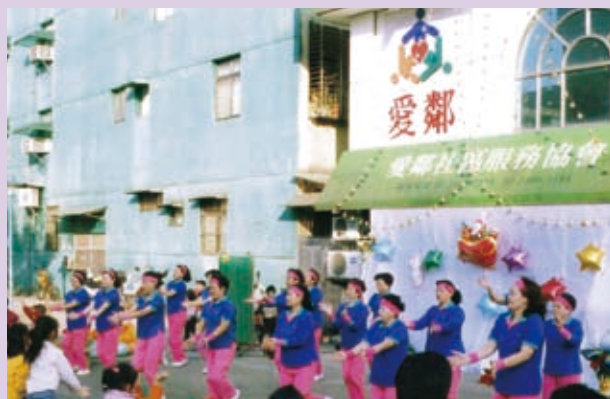
▲瑞芳的讚美操