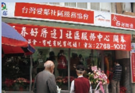
▲「永春好厝邊」社區服務中心於二〇〇六年十二月九日正式開幕。