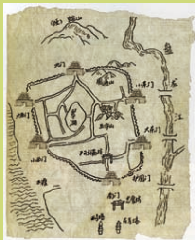
▲昆明龜狀城牆

茶馬古道總共五條，分別由川、滇、青、甘、疆入藏，以川及滇入藏為主，這次我們只走了雲南(滇)這一段。去的城市有昆明、西雙版納、大理、麗江與香格里拉。除了昆明以漢人為主，其他分別是傣