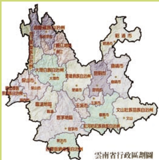
▲雲南地圖(圖／作者提供)

——○○六年我開始告訴別人要去茶馬古道行走禱告，許多人都對這個地點感覺陌生。因為二○○五年是二次大戰後終戰六十年，大陸各地不斷播放二次大戰抗日影片，其中一部就叫茶馬古道。描述二次大戰滇緬公路被炸，當時四川所謂的大後方，作為運輸之用的只剩下茶馬古道這條古老的道路。由各地少數民族的馬隊，將印度物資運往川滇。片中對古道上各個少數民族間的恩怨情仇與生活習俗，作了細膩的描繪，深深吸引我，當時我就知道主希望我去這條路禱告，這是一條入藏的道路，也是西進道路中除了陸絲路與海絲路之外的第三條道路。