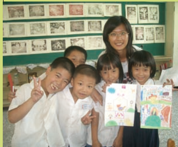
▲圖為民雄靈糧堂在東榮國小所舉辦的課輔班。