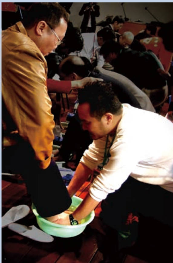
▲ 透過洗腳，使彼此在愛中合一。

我們正處在關鍵時刻，要得著聖靈的大能和恩膏，預備榮耀君王的再來。