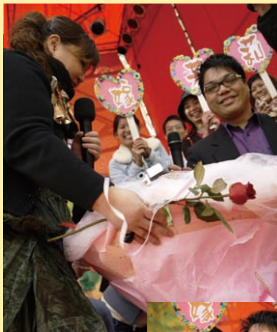
▲「我向神許一個諾言，從妳答應讓我牽手的那一天起，我就永遠不會放手；從那一天起，就讓你牽我的手過一輩子！」