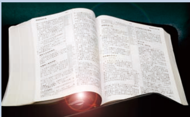
▲ 透過聖經更多默想，進入耶穌生平的時空中，幫助我們能與道成肉身的基督重新相遇。

神操練的第四階段是在主復活的榮耀與喜樂中，學會看見復活的主在萬事、萬物中的掌權與同在！適合的經文便是耶穌復活後的四福音中之篇章，從中省察自己與門徒的態度是否相似，也就是主耶穌的復活或許是客觀的事實，卻未必全然成為我們主觀的體驗與力量。