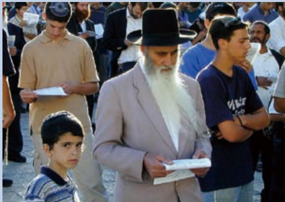
▲復活節是很慎重嚴肅的聚會。

復 活節對你來說是怎樣的日子呢？對許多人來說，只要不放假，就和他沒有太大關係也不重要。當然基督徒都知道復活節的意義，至少理性上同意在信仰上的重要，但除此之外大概就是教會舉行聖餐、洗禮的日子。台灣的基督教會所重視的，會以佈道會來回應，這便是福音派的特色。而傳統宗派還會以大型聖樂崇拜加強當天的禮拜儀式和份量；小朋友則有個紅蛋代表「新生」，幸好台灣沒有傳入美國人的復活兔子等商業性東西。復活節僅僅這樣過一天，難怪不如聖誕節來得隆重有印象。