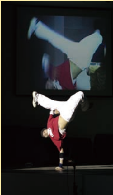
▲青年聖誕 JD舞團表演

廿三日青年牧區BIG DAY的活動，當天兩堂崇拜總人數達三千人；超過七百位新朋友；決志的人數約三百人。一開始舞團的精湛舞藝結合打擊樂的創意，就緊緊抓住人的眼睛；敬拜的活潑更是打破新朋友對教會舊有的看法。