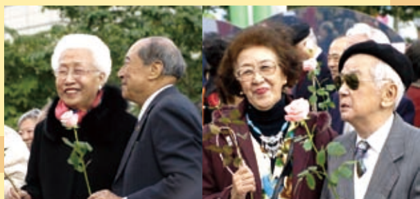
▲ 百對夫妻牽手走在希望廣場的和好大道上，把相愛、恩愛的祝福傳給台北市！