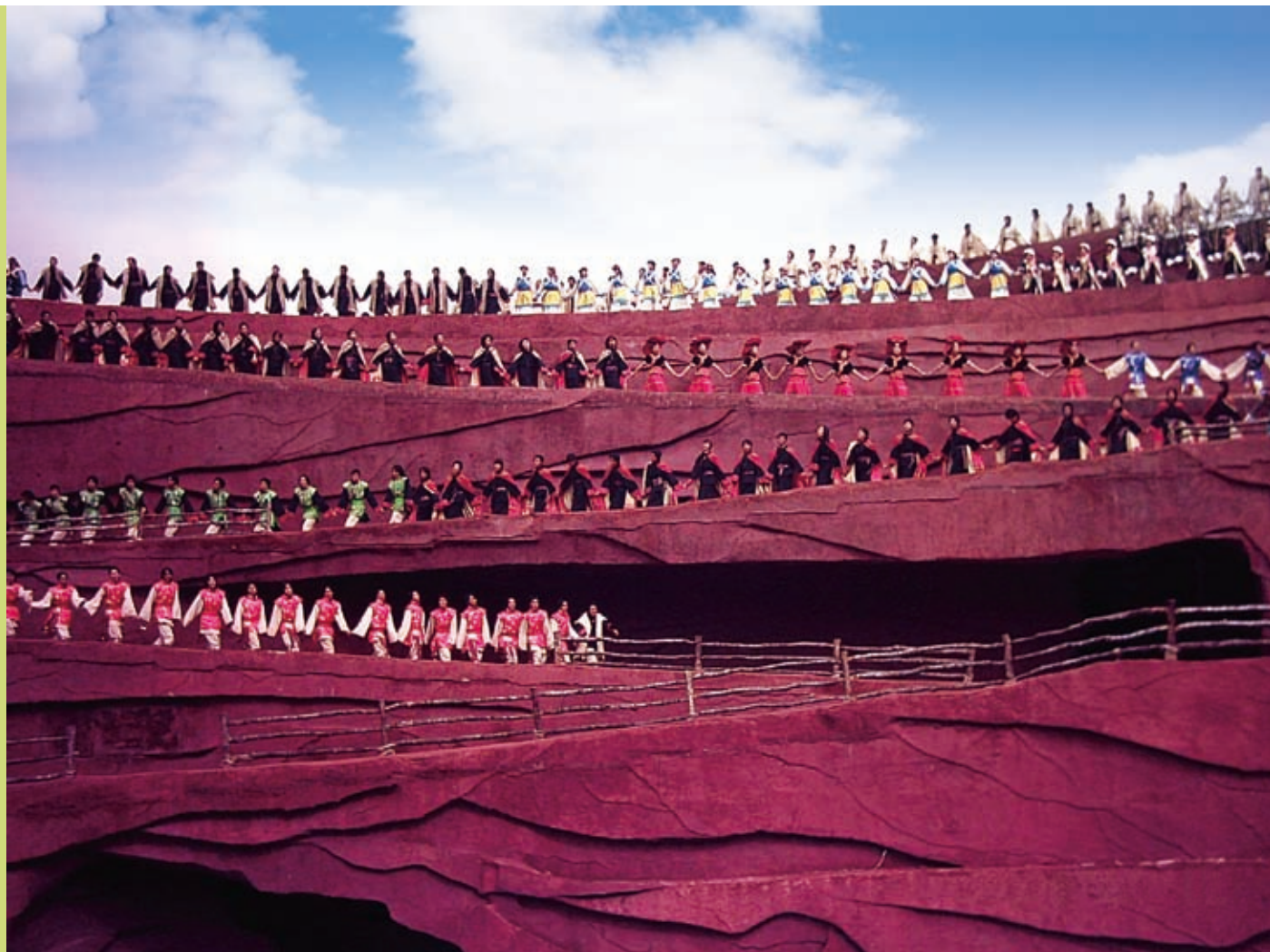
▲「印象麗江」的浩大場面

當晚我們禱告時看見天使在潑水，事後看新聞得知開光當天傾盆大雨，阻卻交通，許多人無法前往。求主更深釋放大理的百姓從自然的恐懼、崇拜及佛教權勢中出來，也求主以真理光照大理百姓，使他們不再活在節期期間的性濫交習俗中。