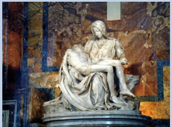
▲ 耶穌為我們而生為我們受死為我們復活