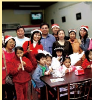
▲福源福音中心佈道會

廿四日上午首次聖誕主日崇拜，感人的真愛見證、聖誕福音信息，與會廿位大人都舉手要耶穌的祝福，同時也有廿四位小朋友參加兒童主日學。一系列活動的最高潮是晚上的報佳音，當我們沿街進入美容院、麵包店、餐廳和社區巷弄唱平安夜時，好多人向我們揮手，並歡迎我們進入家中祝福。