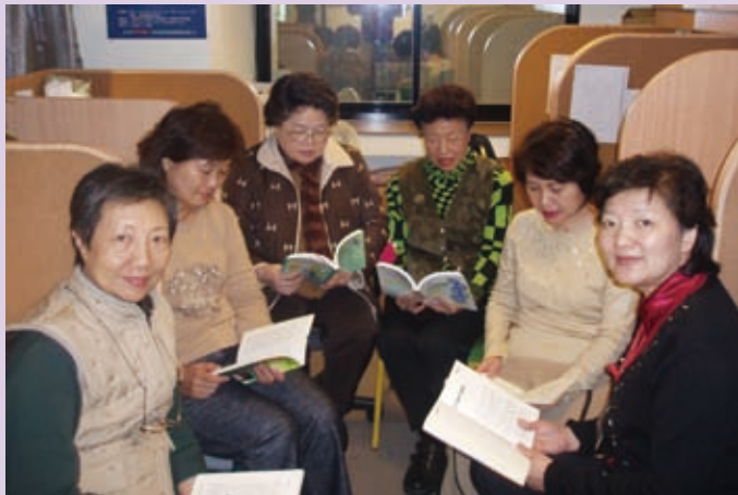
▲福音線讀書會成員。

心思就是戰場。撒但不斷向人發出錯誤的訊息，但我們要學習謹慎分辨，哪些形式的思考為聖靈所接受，哪些則不為聖靈所接受。