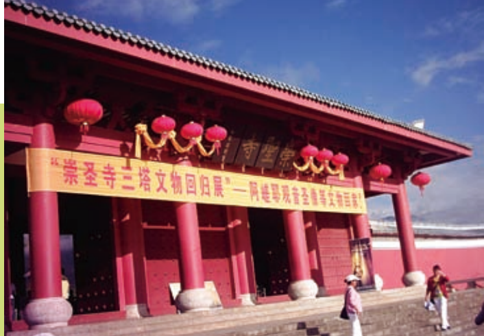
▲大理崇聖寺開光

(版納)」，緊臨緬泰寮金三角，是大陸走向中南半島的過渡地帶。有傣、哈尼、布朗、基諾、拉祜、佤、瑤等十幾個民族，其中傣族佔三分之一。