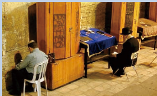
▲我們生命中的林林總總就在默想基督的生平中，如同照鏡子般輝映出來。

初代教會，預苦期(Lent)是為在復活節受洗的人而有的一種自潔的身心預備。原本也不是四十天而是復活節前兩天的絕對禁食，在第四世紀後才逐漸發展為四十天的禁食禱告，而所謂的禁食不是完全的禁止食物與飲水，而是吃素。並且這四十天不包括星期日，因為主日不宜齋戒而應慶祝，於是往前推補足四十日，便是從聖灰週三(Ash Wednesday)開始。二〇〇七年的聖灰日在二月廿一日，正是大年初四，這段預苦期自十七世紀始，不但禁肉，也禁牛奶等乳酪製品等當代的美食，代表一種嚴肅的心態。嘉年華(Carnival)因此也與此相關，聖灰日前的週二，為了過預苦期有必要潔除家中的肉、酪食品，而「Carnival」由兩個拉丁字Carne和Vale組合而成，意思是「大肉再見」。為了不讓魔鬼認出自己，並狂野地奔跑在街頭嚇退鬼魔。只是今日許多拉丁美洲的天主教國家，這節日已不再是種預苦的裝束，反成了迎春的縱樂之日。