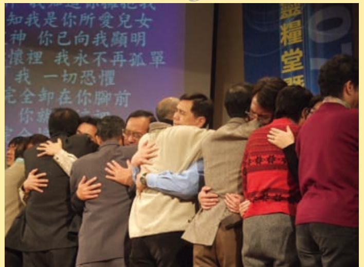
▲「祂必使父親的心轉向兒女，兒女的心轉向父親。」