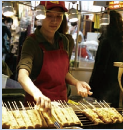
▲要服務業人士信耶穌，一點都不難，難在沒有人把福音帶到他們中間。

台灣的總就業人口九七八萬人中，事務工作人員佔一一〇萬，服務工作人員及售貨員佔一八五萬，農、林、漁牧工作人員佔六十三萬，勞工佔三二五萬，這就是說，就業人口中服務業共六八三萬人，佔70%。