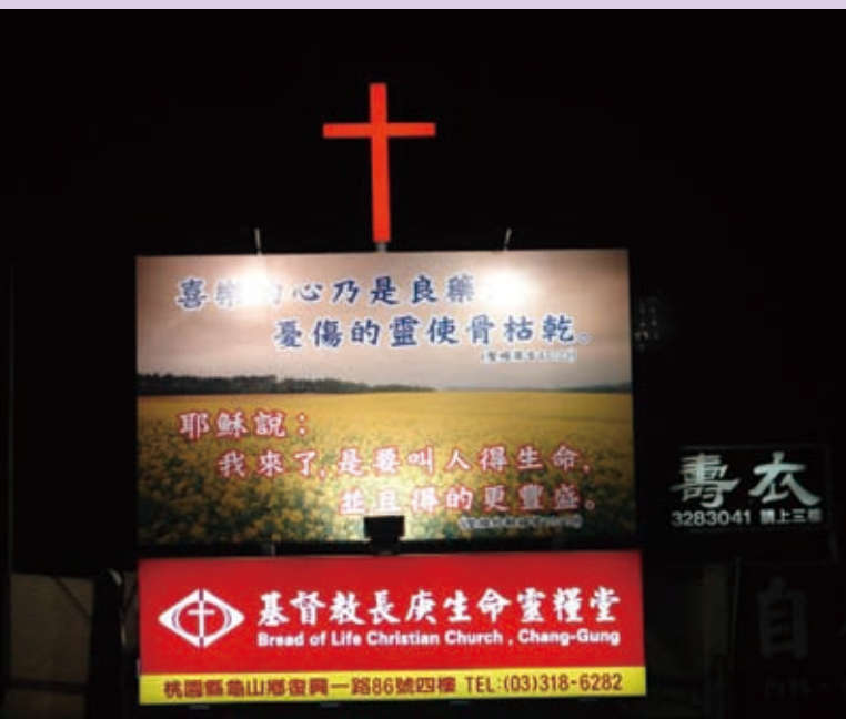
▲長庚生命靈糧堂上方高聳的十架，真給人極大的盼望。

原本抱著投資的想法所購買的房子，因著神奇妙、榮耀的作為，而被分別為聖，為神所用。