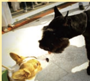
◀ 素未謀面的狗狗們交個朋友吧！