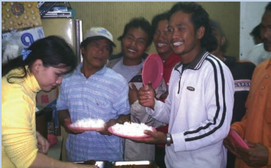
▲(圖/印尼語牧區提供)