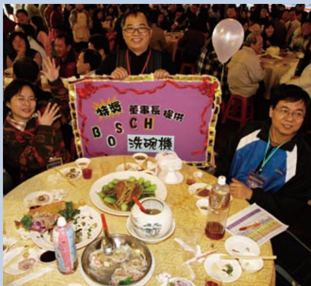
▲第一特獎得獎剪影。

最特別的是，第一天為這些撥冗回來的家人們接風洗塵的，是一場別開生面、最有人情味的「台式辦桌」！特別對為數眾多的中南部分堂而言，正是娶親筵席，祝壽般的熱情歡迎式！