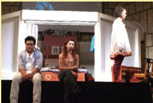
▲媒體中心舞台展演組聖誕劇

「茶花夢圓」有人連看了四場，有人看到一半就走了，有的人後來才來，大多數的人用行動回應或者留言在回應單上。這四場下來有一種現象：越來越少旁觀者，因為場內的回應越來越多。不是我們換了節目或加了特效，而是耶穌越來越受歡迎；不是戲劇或多媒體效果，而是祂自己降卑在我們中間，個別敞開祂自己，讓觀眾自己按著需要把祂帶回去。