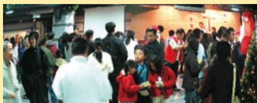
▲「永和福音中心」嘉年華園遊會

綿綿冬雨可不是一個好兆頭，但主確實是我們隨時的幫助！神把「榮光」釋放在我們的臉上！滿滿一籬筐的恩典數算如下：1.冬雨中，同工仍能在信心裡預備。2.陰雨裡，同工在感恩中仍獻上讚美的祭。3.綿綿雨勢中，同工們在喜樂中迎接了五、六百位鄰舍、賓客及兄姊；其中有四百多位留有電話或地址。4.使用《滿福寶》決志者近百位，透過趣味照相願意接受探訪者亦有一百多位！