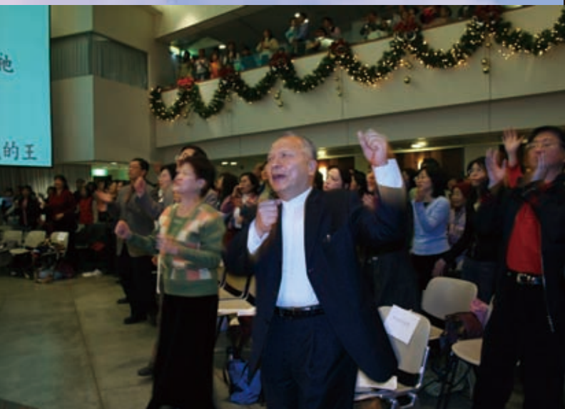
▲圖為跨年禱告會。