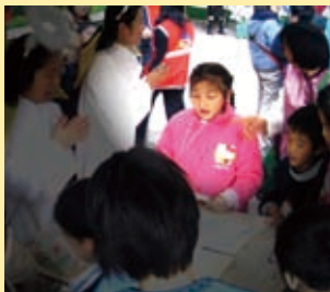
▲ 五分埔福音中心聖誕佈道

活動在獎品豐富的摸彩中劃下句號，將近三百人參加，其中近一百人接受禱告祝福，每個孩子都帶著一份特別禮物回家，住戶們說：「許多年來，沒有這麼熱絡過。」