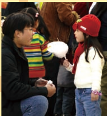
◀ 小孩和棉花糖一直為希望廣場帶來純真與歡樂！