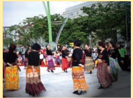
▲台語長春團契聖誕慶祝會

整場擠滿超過三五〇位長輩，溫馨感人，神的愛懷擁我們從年輕到髮白，現場的參與者皆被神的恩膏大大摸著，無不動容。