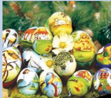
▲復活節的彩蛋象徵春天及新生命的開始

願意認真過復活節期的人，才有機會真正地認識生命的苦與罪、羞辱與榮耀、痛悔與重生。