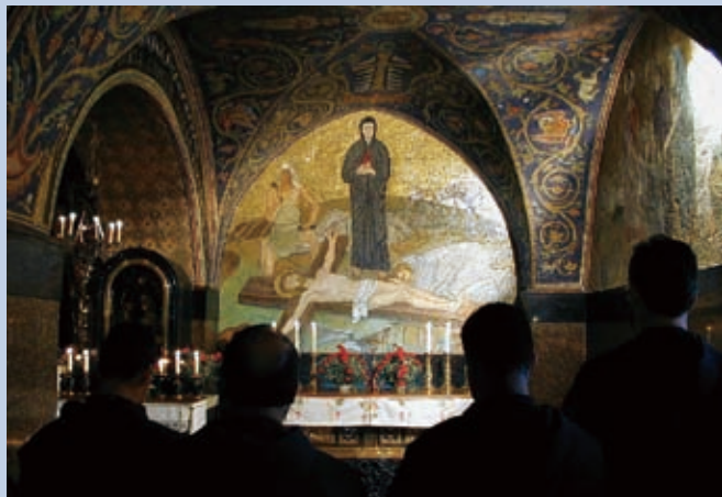
▲ 整個預苦期的中心意義，是記念耶穌的道成肉身、受苦、受死、與復活，因此透過經文默想與基督同行。