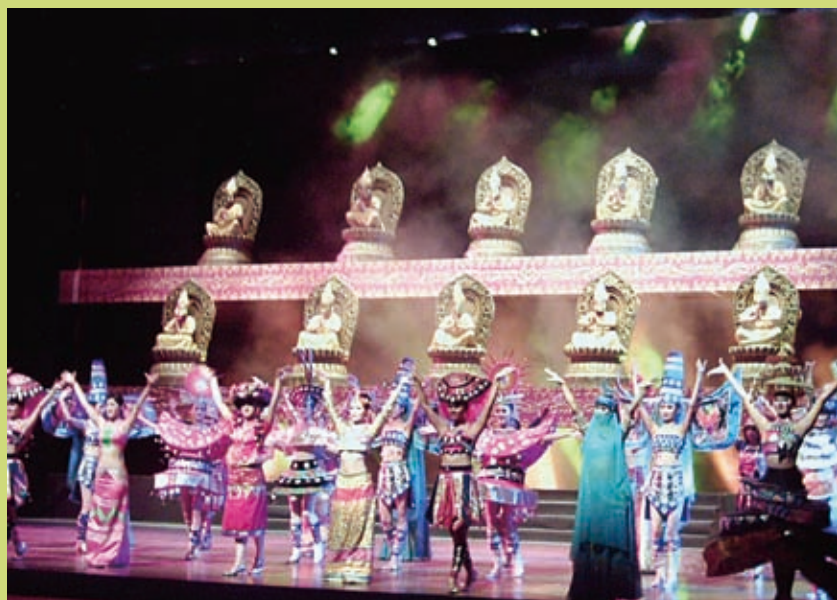
▲西雙版納——自然與佛教文化的結合

第二天我們到洱海畔的崇聖寺三塔，赫然發現隔天正是海內外一〇八名高僧要為崇聖寺開光的日子。大殿中擺滿四千人民幣一張的座墊，我們行走在其中禱告，求主破除佛教勢力在此再一次掌權。大理歷代君王多人出家，有自願也有被迫，顯然因政治險惡不得不遁入空門，使得大理的政治與佛教一直脫離不了關係。崇聖寺中有一座天王廟，在所有廟堂最前面，代表當地本主信仰已被佛教收編，成為護法。天王廟中的大黑天身披骷髏，纏繞蛇身，據說是為瘟疫而犧牲自己的天神，這是假救贖，而且我們意識到帶給大理各種天災的就是這個黑暗權勢，也是我們先前所意識到的那陣冷風。