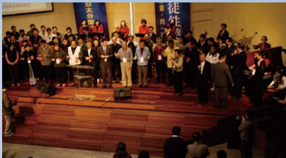
▲當教會在合一裡誕生，就會繼續在合一裡增長。