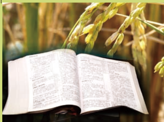
▲充分的職場訓練與神話語的裝備，是職場宣教的必要條件。(圖／王瑞庚提供)

事。但我們不要讓在職場上宣教的弟兄姊妹成為烈士，不然就像夢中那位——在天上飛得很快樂卻缺乏糧食及裝備的人。在聖經中，「糧食」就是神的話。當我們有了神話語及聖靈大能的裝備，再加上職場上的各樣訓練，就可以成為神手中的刀、袋中的劍，是快齒打糧的新