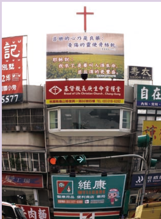
▲ 十字架旁邊黑色的「壽衣」兩字，形成了極強烈的對比。