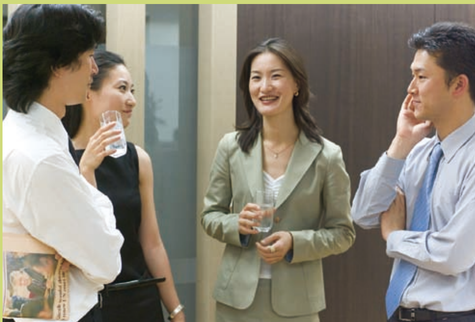
▲ 在辦公室中受人尊敬、佩服、欣賞是職場宣教非常重要的條件。

我們必須接受裝備，才能做權能宣教。求神幫助，使教會能為弟兄姊妹設計一系列從大學畢業開始，直到退休的各階段裝備課程，好讓我們每一位在職場上都可以作戰士，而不是烈士。