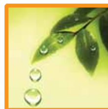
「靈命日糧」 「信心之旅」 「見證分享」 「心靈小故事」