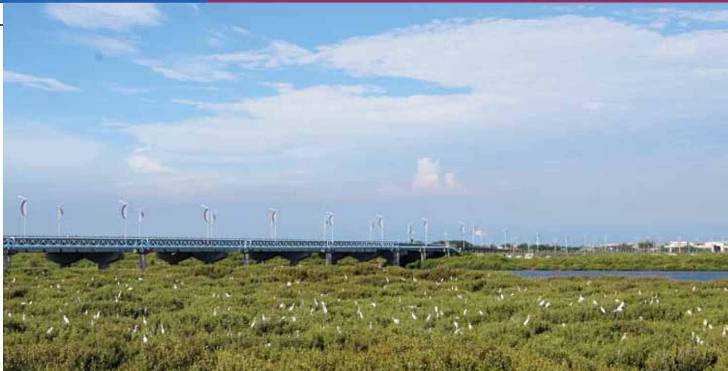
東石大橋下的朴子溪河口紅樹林是白鷺鷥族群的棲息地。