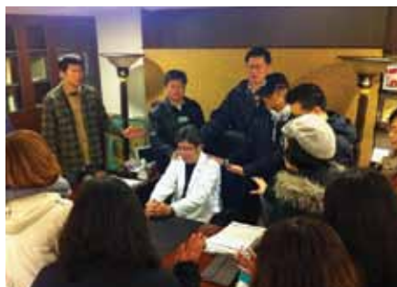
弟兄姊妹至辦公室禱告

地圖，就是以一種新的眼光，看透日常生活萬象的背後，有什麼樣的靈界勢力在活動。」他又說：「繪製屬靈地圖的工作，是要把靈界活動的畫面重疊在現實生活上」；「把我們所知靈界各種勢力的分佈範圍、各種靈界所發生的事件，及其在現實環境中所造成的影響描繪出來。」更清楚地說，所謂「屬靈地圖」並不是一張地圖，它是一份某地區的屬靈情勢分析報告，這份報告當然也附有說明用的圖表或地圖。「屬靈地圖」對於屬靈爭戰的重要性，如同X光片對醫師，以及一張戰情地圖對於一位前線指揮官那般重要。