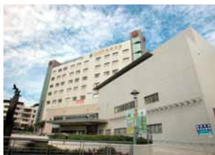
樂生療養院新院區