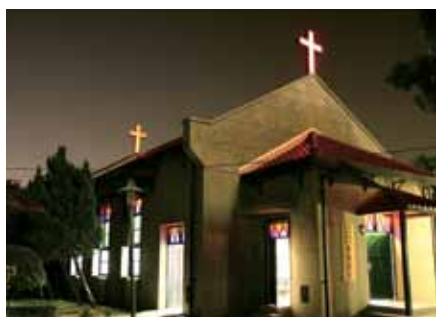
樂生療養院內的聖望教會