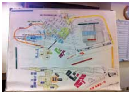
屬靈地圖(作者提供)