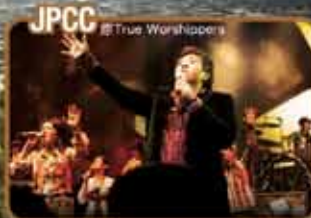
JPCC True Worshipers