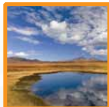
考門夫人原著 「荒漠甘泉」