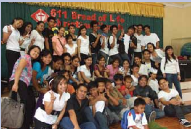
六月中，土甲盧611的青年人在大學舉辦音樂佈道會。