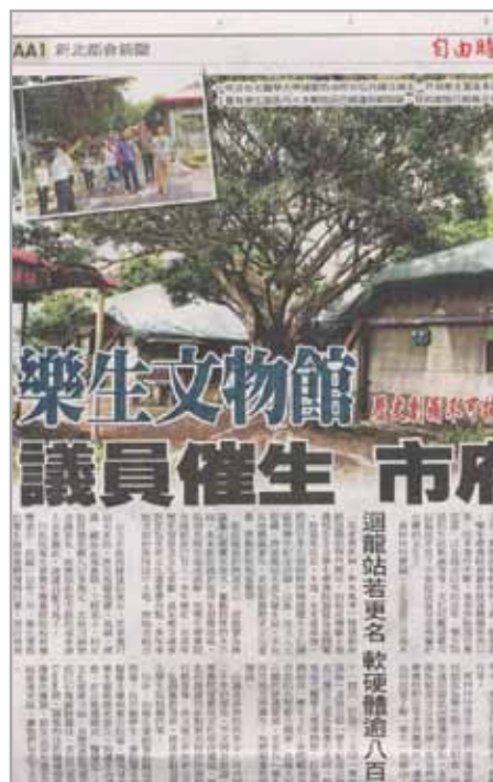
迴龍站更名新聞剪報