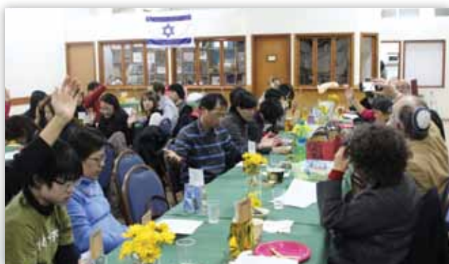
在海法與猶太信徒領袖聚餐。