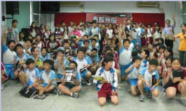
進入國小教導「青春無悔」課程