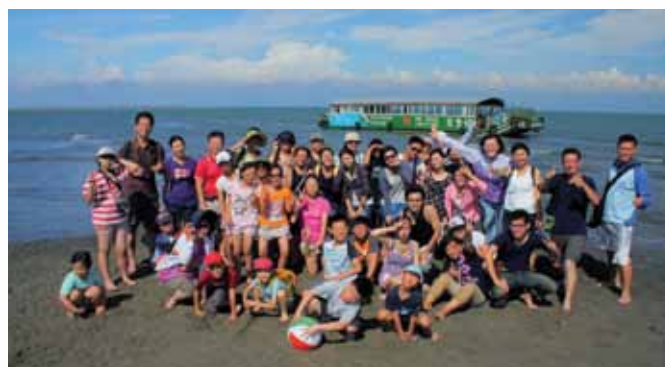
兩岸及城鄉交流在漂流的國土——外傘頂洲。