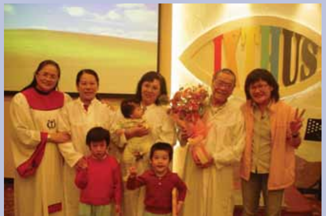
受洗及嬰孩奉獻禮