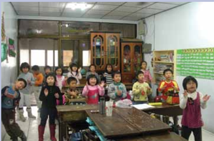
課輔班聖誕節詩歌教唱