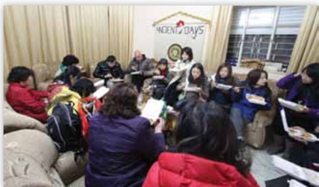
在伯利恆與阿拉伯信徒及慕道友聚餐。