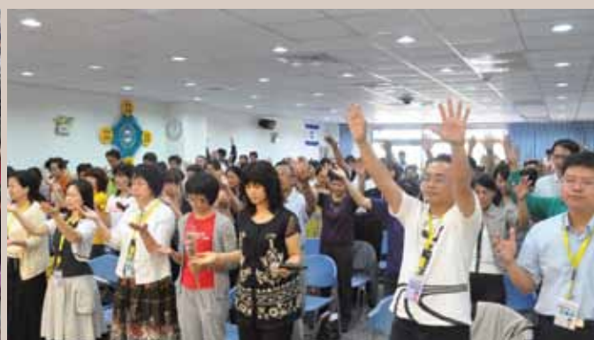
台東靈糧堂主日崇拜。