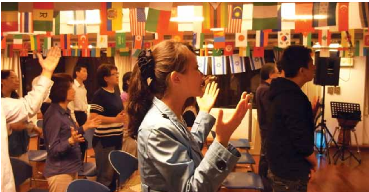
在禱告會中敬拜讚美。

—— 〇〇九年六月七日在區永亮牧師和朱黃傑執事的帶領下，方舟辦公室正式成立，開始了方舟事工探索與感恩的旅程。方舟事工的起源，是來自二〇〇八年金融海嘯後，教會為了扶持因經濟環境變故而陷入財務困難之會友家庭，所推出之一系列慈惠專案；事工的主要目標在於協助教會裡從事微型商業(真正的「小」生意)的兄姊們，拓展商務，改善他們的家計生活。