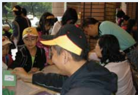
兒少牧區學童春季成長營會——豐聞有你。