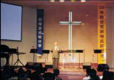
二〇〇〇年更新成長特會