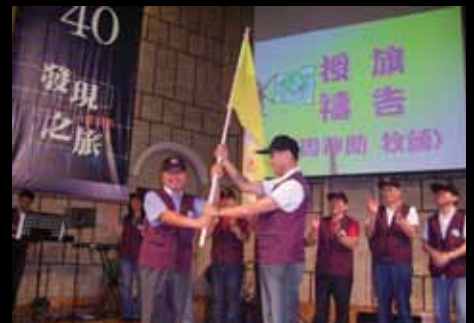
二〇〇五年標竿人生授旗禱告