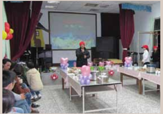
2010年在神木國小舉辦聖誕餐會。