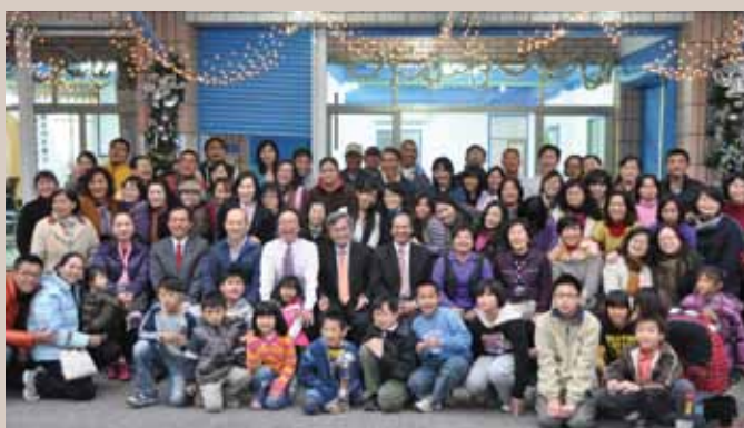
自由成功靈糧堂開幕禮拜。