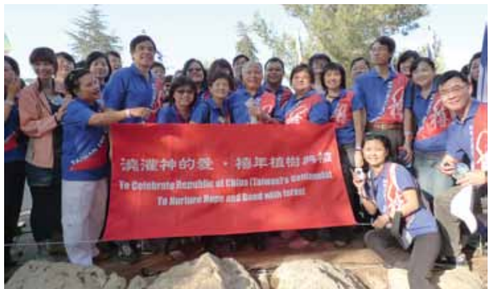
二〇一〇年帶領教會同工和分堂、友堂牧者到以色列種樹，為台灣及以色列祝福。