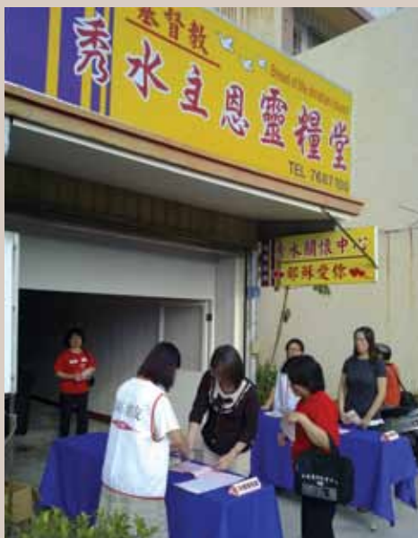
2010年秀水靈糧堂愛鄰關懷中心。