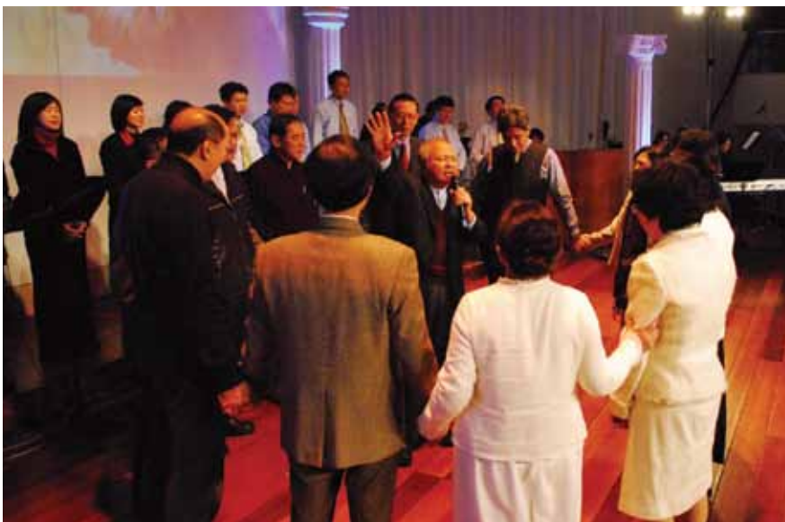
領袖團隊彼此的關係，不只是事工的相連與相助，更是生命的相通與相顧。(媒體中心提供)