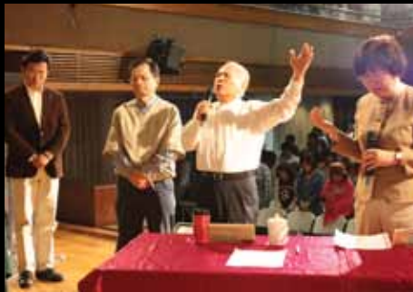
二〇一〇年「災難與方舟」論壇