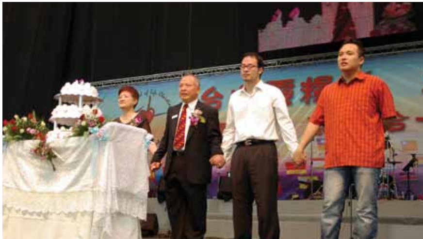
全家一起在靈糧堂服事神。

牧養教會雖然充滿很多挑戰，但我們確知教會是主的身體，神說祂要在教會當中得榮耀，就必定會得榮耀！周牧師因此領受「建立榮耀的教會」的異象，我們就對榮耀的教會充滿了盼望，知道神必定會成就。