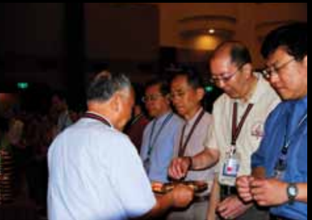
二〇〇八年靈糧特會合一擘餅