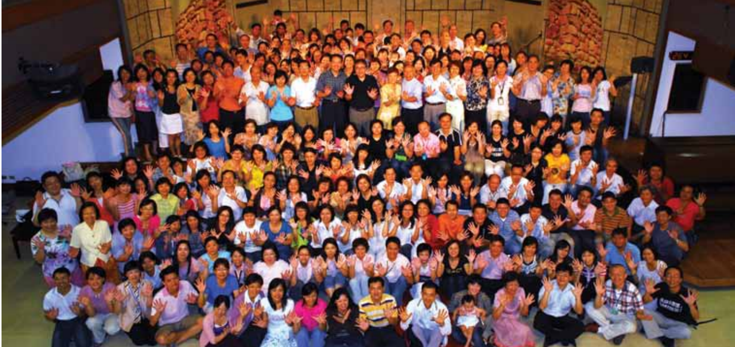
二〇〇九年台北靈糧堂全體同工合影。