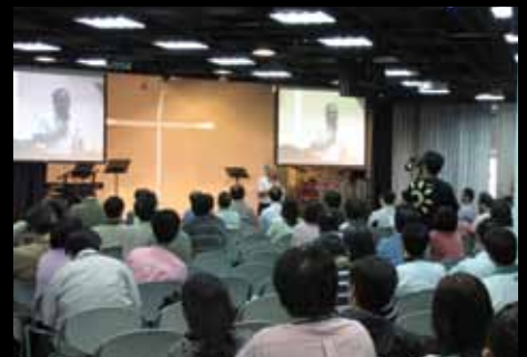
召聚全台靈糧分堂牧者、領袖傳遞遍植異象

2009年 教會舉行55週年慶，歸納本堂的七個核心價值：聖潔導向榮耀的教會、更新導向復興的教會、平衡導向健全的教會、合一導向團隊的教會、外展導向植宣的教會、僕人導向服務的教會、國度導向轉化的教會。