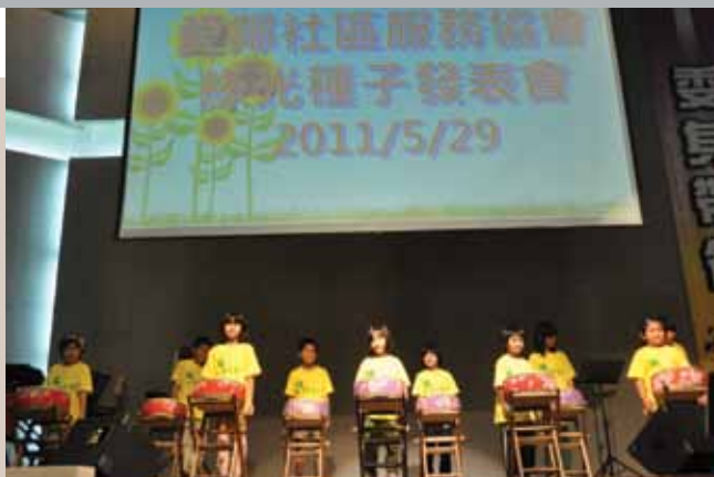
2011年綠光種子發表會。

由於教會所做的社區關懷工作有實際的果效，因此向社區募款時，得到了許多善意的幫助；我們希望內政部提