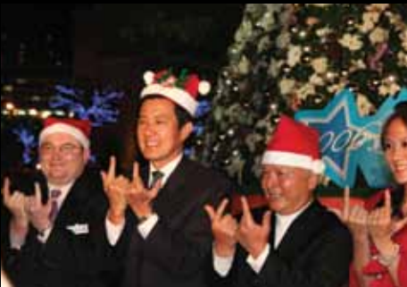
二〇〇六年台北聖誕節