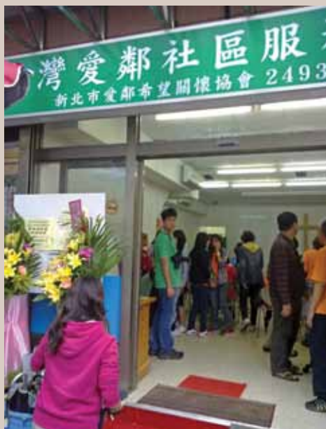
2011年新北市雙溪愛鄰。(作者提供)