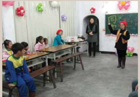
2010年在同富村舉辦聖誕餐會。