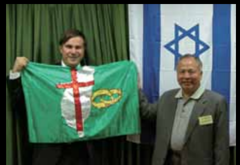
與以色列的合一與連結

1998~1999年 「強本南進」→「強本西進」→「強本全進」；並邁向「四中」——在中國、中南半島、中亞、中東地區；至今已在全球各地建立261間分堂，以及13間福音中心；期待遍築禱告祭壇，遍植宣教據點。