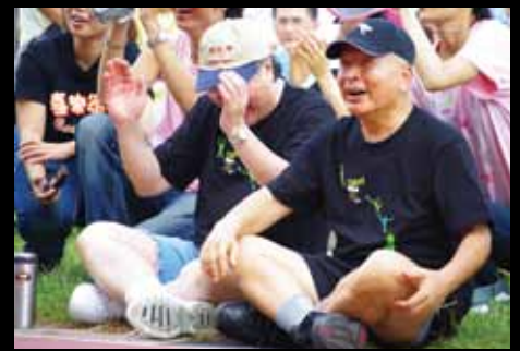
一九九三年全省傳道同工會

1986年 教會開始快速增長；1989年主崇平均人數是2,153人，受洗人數是179人；2010年聚會人數已約9,500人。 1990年 成立「靈糧教牧宣教神學院」（因1990年，泰國的賽克牧師來台舉辦特會，將公元二千年的異象傳遞台灣眾教會。當時台北靈糧堂看見在台灣大量植堂的需要，以及承接宣教使命的必要性）。