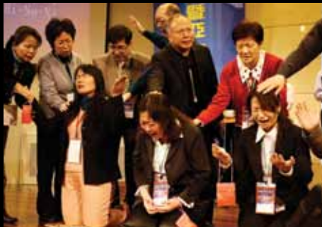
二〇〇七年靈糧特會差派