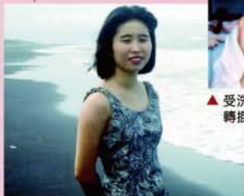
▲年輕的外表其實已承受了很多的壓力。