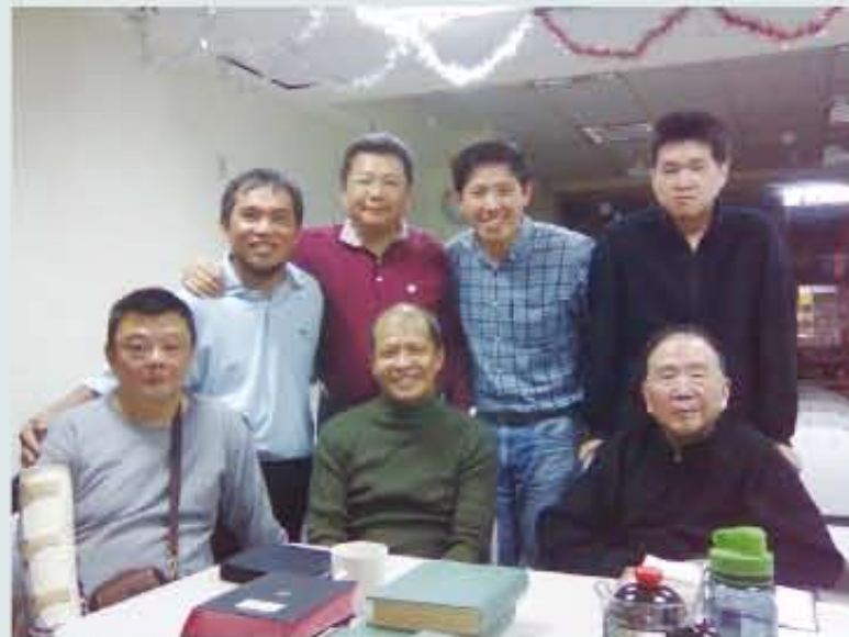
▲教會早上的晨禱，鉞鋒幾乎從來不缺席。