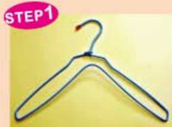
▲將衣架的兩端往下壓。