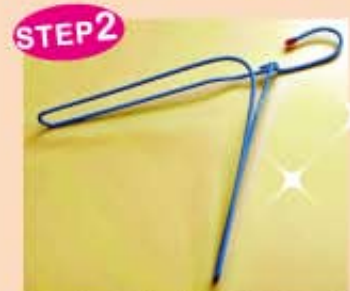
▲再把原本橫桿的部分稍微往前拉一點點，就成簡易的雜誌架。