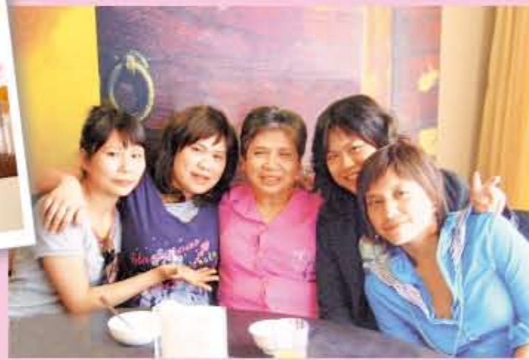
這是我的家人，老媽是不是很有福氣！有四個女兒陪伴。