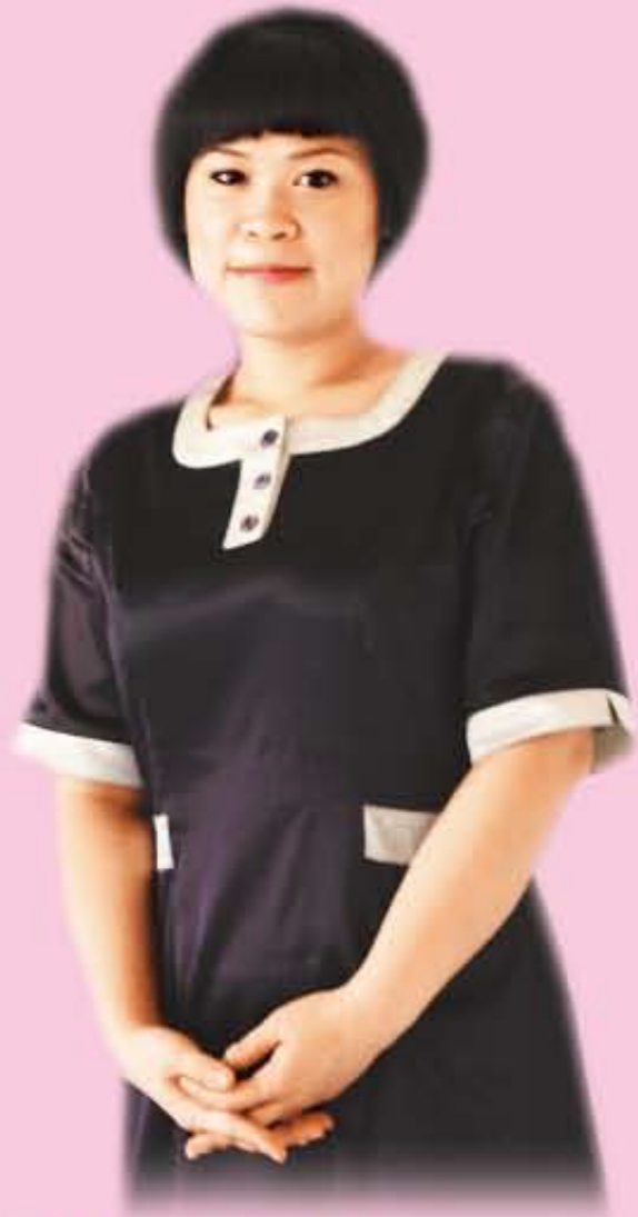
燦爛/採訪報導·攝影

十歲那年，有一天放學回家搭公車，公車來的時候，我才上了後門，車子就開了，我嚇得緊緊抓住把手，整個人盪在外面，但最後還是被甩出去，跌落車輪下，公車的大車輪就這樣直接地從我的腿上碾過去。當時，我以為我死定了。