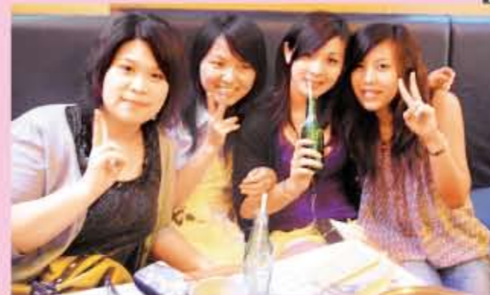
過去的老同學都很希奇我的改變。