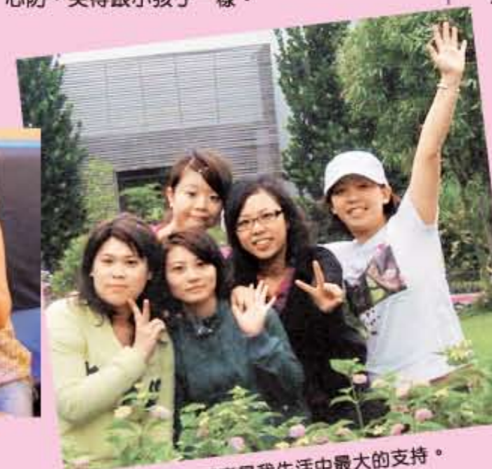
同事是我生活中最大的支持。