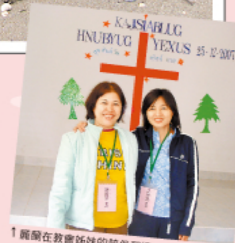
↑ 麗蘭在教會姊妹的陪伴和協助下，勇敢面對未來。