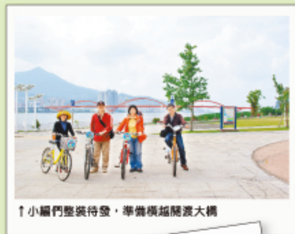
↑小編們整裝待發，準備橫越關渡大橋