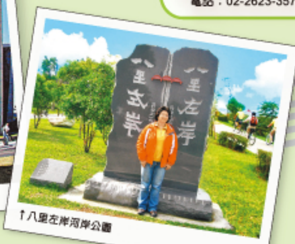
↑八里左岸河岸公園