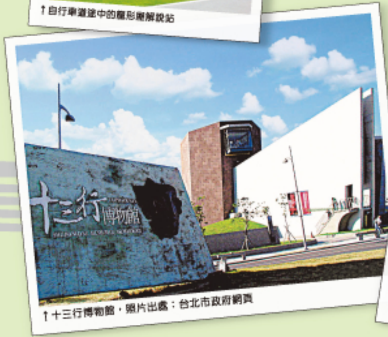
↑十三行博物館