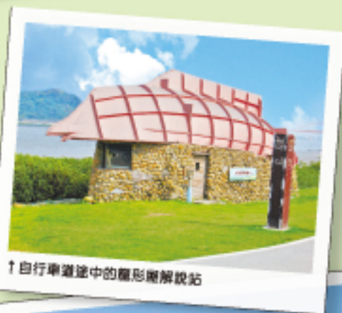
↑自行車道途中的龍形圖解說站