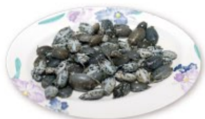
小小的「浪花蟹」，外觀一點都不像螃蟹，由於採倒退移動的方式，所以又被稱為「倒退嚕」，也是南澳海產美食中被指定的佳餚。

來宜蘭南澳露營，露友們第一個會想到的便是「南澳農場」。佔地寬廣，提供完全免費的水電及衛浴設施，近年來經好評的遊客奔相走告。