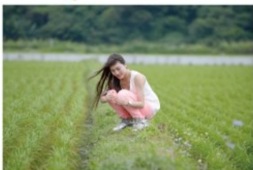
「友積南澳」園區沒有被汙染，灌溉水直接從山上下來，南澳地區沒有工廠，又是第一道曙光，這裡是最適合做有機耕種可遇不可求的園區。