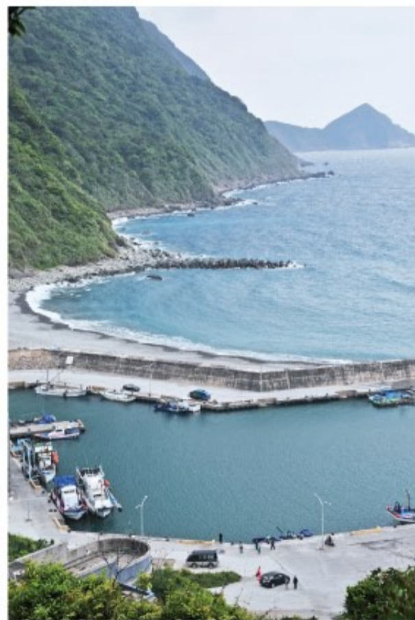
「朝陽漁港」(南澳漁港)北為烏石鼻生態保護區，附近海域資源豐富，漁港旁成為磯釣群們的最愛，也是蘇澳鎮南邊漁獲最豐富的漁場。