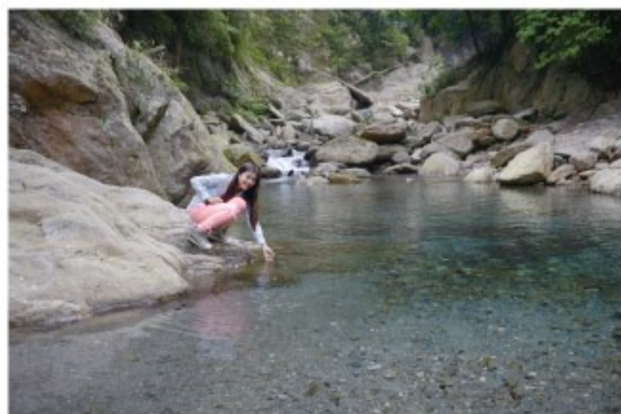
「金岳瀑布」位處不受人為破壞的南澳山區，溪水清冽澄澈，天氣晴朗時，溪水透射出淡淡的藍綠光，使得瀑布區成為盛夏尋幽探祕的好所在。

早年傳教士落腳南澳，由於物資缺乏，利用香甜的清冰添加紅豆、花豆、綠豆及花生、蛋黃，於是一碗有故事色彩的「傳道冰」就問世了。