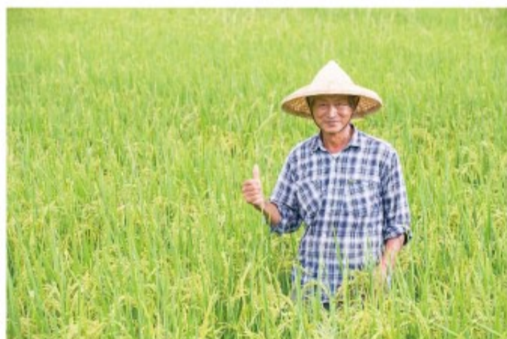
一群疼惜南澳的好水、好人、好土地的老農民，重新戴上斗笠，回到田間，與南澳張牧師一起打拼，創造出有機品牌「牧師的米」。