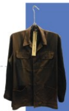
昔日四四兵工廠的員工制服

充滿了老屋老樹老味道。吊鋪等擺設之居住樣式，穿梭在巷弄之間，盡量保留眷村窄巷及舊有客廳、臥室、