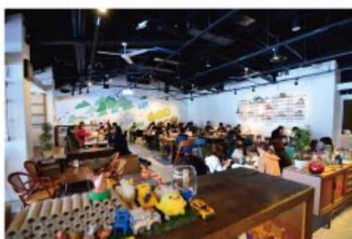
《好,丘》複合餐飲空間，店內傢俱則是四處搜來的二手舊物拼成一幅溫暖的居家空間，讓店裡的客人可以感受到在自家客廳裡的自在與親切。