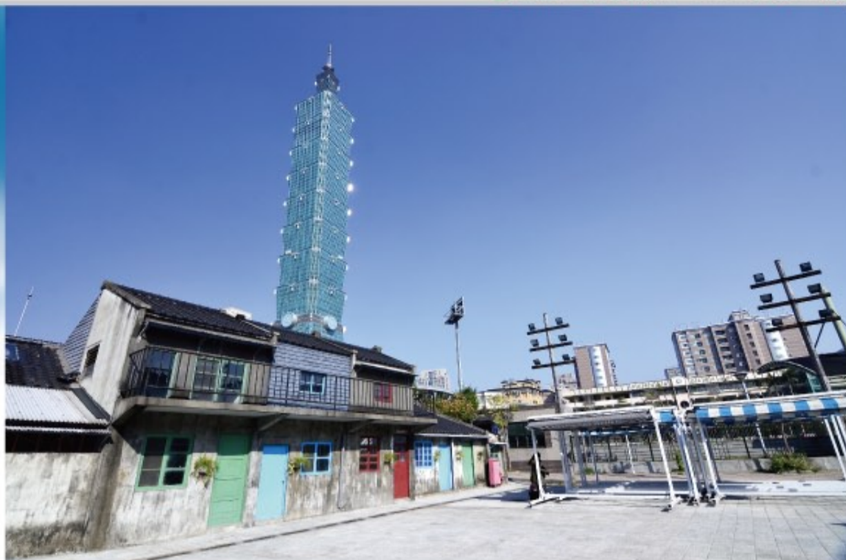
四四南村與背後的101高樓形成強烈的對比，歷史與前瞻在此交會。

台北信義區，熱鬧又新潮的地方。就在世貿對面的一塊綠地，有幾棟懷舊的建築，散發著舊時代動人的氛圍，那是「四四南村」。民國37年大陸四四兵工廠遷台，員工眷屬所建立的眷村，這裡可是台灣第一個眷村喔，文物館展出眷村文物，景觀草坡模擬舊有的眷村景觀，為這個前衛的都市保留住一段光陰的故事。《好,丘》複合餐飲的入駐，更展現出台灣年輕的活力和生活美學，無論天晴或雨，你都可以在《好,丘》將各種美好打包，然後與更多人分享。