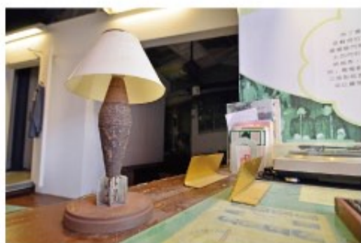
眷村文物館的常設性展出有：眷村童玩、眷村生活用品，其中最令人印象深刻的，就是因當時物資缺乏，用廢棄的彈殼所作成的「炮彈燈」。