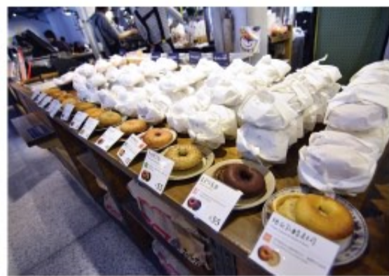
在充滿故事的老眷村裡，好丘想用每日新鮮出爐的「貝果」，來代替從前的槓子頭、饅頭繼續飄香，各種口味一字排開，令人食指大動。