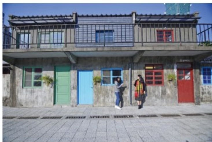
早期四四南村的巷子特色，門口對門口，牆面竹籬笆和石灰所建造，木製的門和窗，民眾從街巷空間紋理，可以體會出往日眷村的純樸風情。