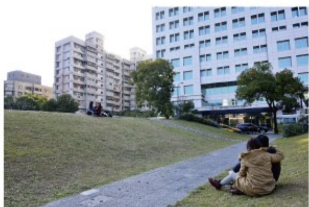
廣場往外延伸，設計了布滿綠色植被的「低矮屋頂」，進一步讓市民有機會體驗眷村小孩爬上屋頂(草皮小丘)，遙望藍色天空的生活經驗。