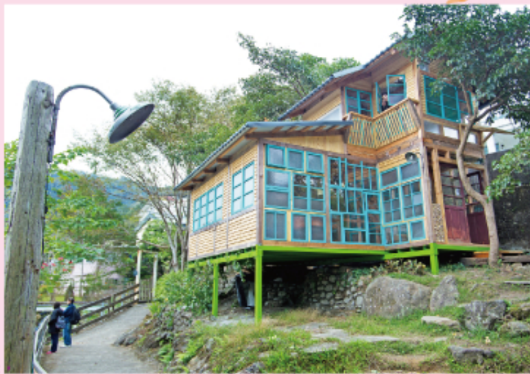
▲2015年啟用的台灣水色設計工場，利用台灣伐木業在地資源建成迷人復古風木建築，並用大量玻璃引進光線，節省用電，符合綠建築概念。