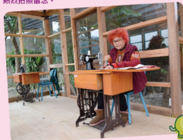
◀台灣水色網羅到了一群縫紉經驗豐富的客家媽媽們，使用傳統腳踩針車，搭配現代花樣布料，組合織成包品，獻給遊客台灣最美麗的顏色。

◆愛情合興車站 (03)623-5065 新竹縣橫山鄉力行村中山街1段17號 ◆好客好品希望工場 (03)584-9569 新竹縣橫山鄉內灣村內灣139-1號