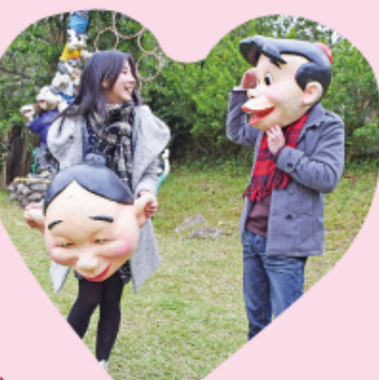
▲劉興欽漫畫展覽館提供劉興欽老師經典漫畫裡面的兩個人物「大嬸婆」和「阿山哥」人偶頭套，吸引遊客戴上頭套熱烈拍照留念。