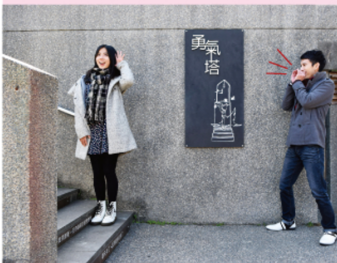
▲通往幸福的許願鐘，必須先踏上勇氣塔階梯，階梯每一層都寫滿了戀人絮語，要鼓勵愛情路上的戀人勇敢去愛，才有機會敲響幸福鐘。