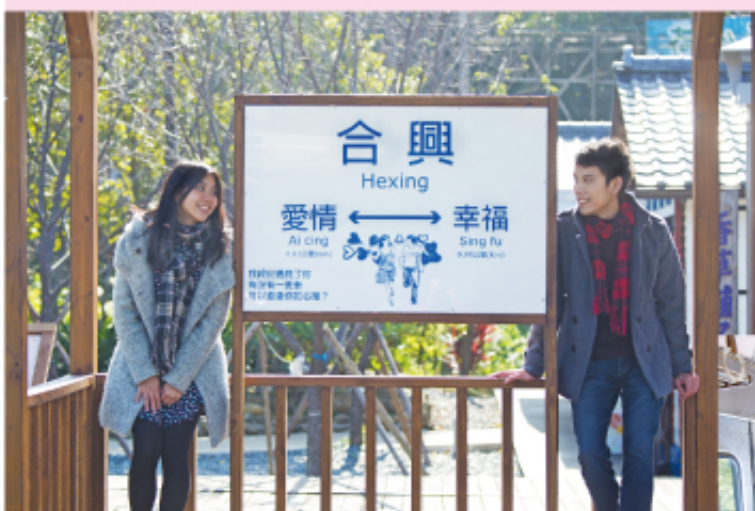
◀戀人說，我終於遇見了你。聽說遙遠的新竹，有個愛情火車站，我們相約搭下一班車，去預約我們的幸福。