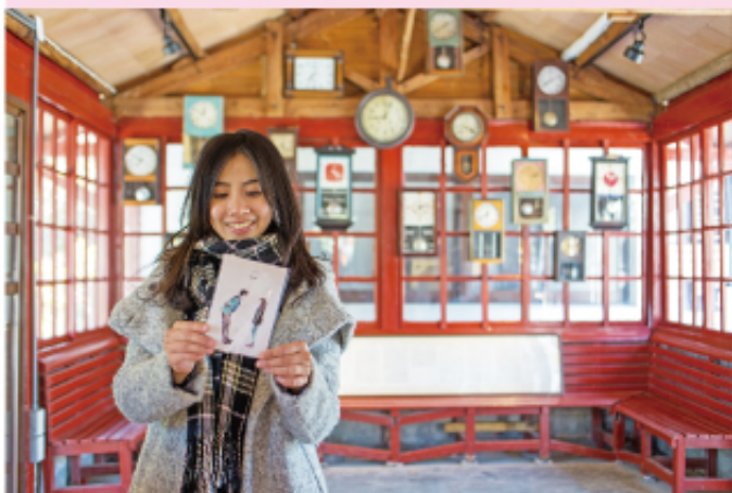
▲一走進愛情候車亭，牆面掛滿了24個骨董時鐘，個個鐘時間都不同，時間在鐘擺光影下旅行，意味每個時刻，都有著一篇愛情故事。