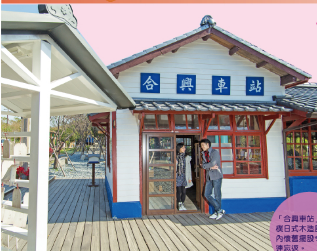
「合興車站」保有古樸日式木造風格，站內懷舊擺設令戀人流連忘返。

內灣，台灣著名的鐵道觀光支線。這條支線進入內灣老街前會經過一個小站，一個你不小心就會忽略的「愛情火車站」，原本面臨被廢站的命運，但因情牽一個動人的愛情故事，而被保留至今。由於「薰衣草森林」入駐，整個車站充滿了愛情的元素，車站也因此重生，戀人們，買張愛情的單程票，勇敢踏上旅途。內灣也不只有老街，它還有一座文化創意園區「好客好品希望工場」，在這裡可以看見老字輩劉興欽漫畫家的展館，客家傳統餐飲搭法式擺盤，腳踩針車搭現代花布，跳脫出傳統客家刻版的印象。